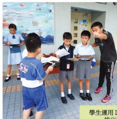
學生運用 IPAD 內的方向儀進行定位，找出學校設施的正確方向。

同時，為了進一步提升學校的學與教質素，本校成功向教育局申請「電子學習學校支援計劃」，成為 wifi 100 學校。是項計劃目的是為 100 所公營學校提供資助，於每一個課室鋪設無線上網系統，並資助學校購買平板電腦，從而配合師生課堂中使用電子教科書和電子學習資源，讓學生進行各種的學習活動。