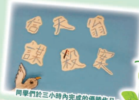
同學們於三小時內完成的優勝作品。