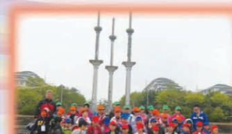
師生們在院士廣場留影。