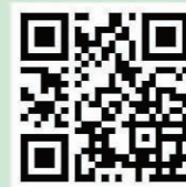
獲獎定格動畫 QR code

本校學生設計的作品名為「信天翁謀殺案」，在短短 30 秒定格動畫中，展示出人類對海洋的污染帶來嚴重的生態災難。最終本校學生榮獲三項大獎，分別是小學組「惜物減廢」環保定格動畫比賽榮譽大獎、環保定格動畫比賽學校大獎及「我最喜愛的環保定格動畫」社交網站公投大獎，表現卓越。大會更將本校的作品上載至是次比賽的 FACEBOOK 專頁。