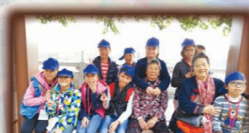
同學與梅州居民聊天情況。