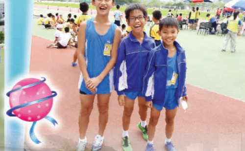
同學們都面帶自信的笑容。