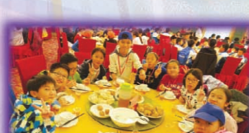
藍組學生正在享受一頓美味豐富的早餐。