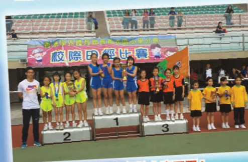
女子丙組奪得接力賽冠軍！