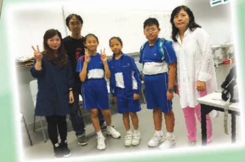
同學們與定格動畫指導老師拍照留念！