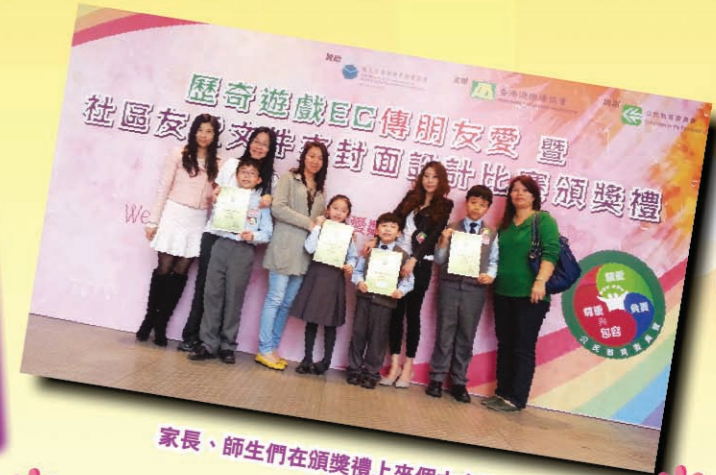
家長、師生們在頒獎禮上來個大合照。