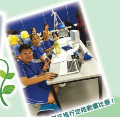
三位同學正進行定格動畫比賽！