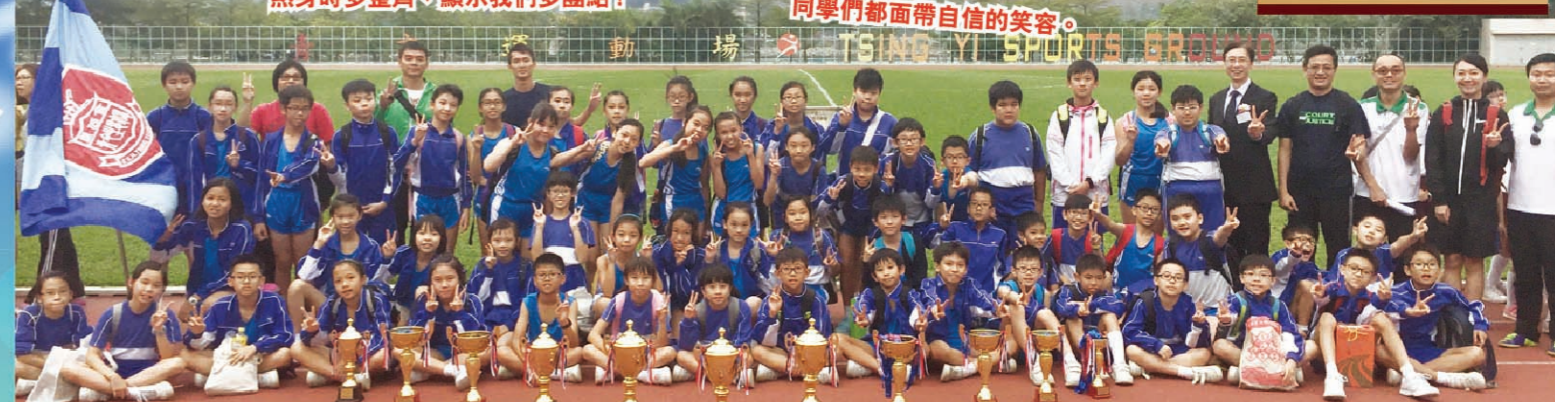
師生大合照！看看獎杯的數目，可知是同學們奮鬥的成果。