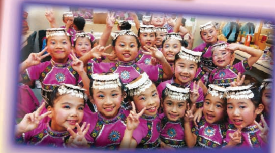
低級組以《勒北樂》獲邀參與第五十二屆學校舞蹈節優勝者表演