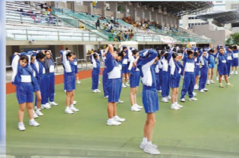
熱身時多整齊，顯示我們多團結！