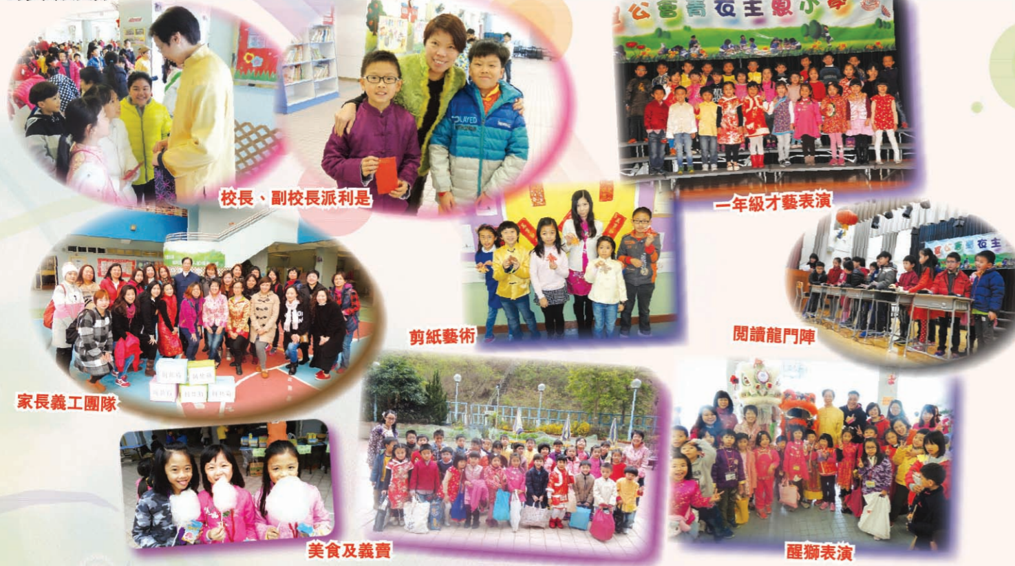
校長、副校長派利是

由於家長及同學們對義賣活動的鼎力支持，不少精品瞬間售罄。此外，義賣食物的棉花糖、爆米花及糖蔥餅等特色小食，亦深受學生歡迎。是次活動籌得款項共二十一萬二千三百九十三元，將用作改善學校設施及教學用途，並衷心感謝各位家長、老師及同學們的參與及支持。