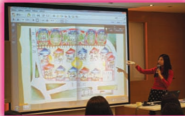
在《十八區社區藝術地圖》視藝出版計劃分享會上，陳老師向其他學校的師生分享創作經驗。