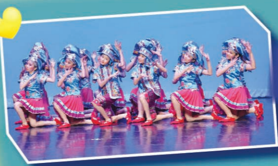
中國舞高年級組以《布衣小丫》參賽，榮獲高年級組中國舞 (群舞) 優等獎