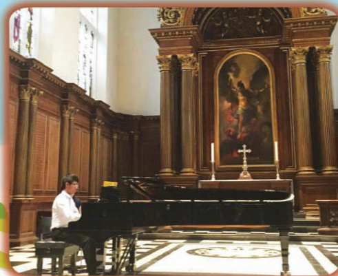
於劍橋大學演奏鋼琴

我熱衷於辯論，自中二起便是中文辯論隊的一員，曾任副隊長，亦於公開比賽獲得最佳辯論員的殊榮。辯論不僅是提升演講及寫作技巧的良方，更是深入了解時事議題的途徑，因此我亦參與校外辯論機構，積極推廣辯論。此外，本學年擔任領袖生長一職，是為學校服務的良機，從中能磨礪個人溝通及領導才能；至於其他學術範疇亦有所涉獵，包括奧數隊、管樂隊、中文學會等，因此有幸獲校方認同我一直以來的努力，被選為年度傑出學生。