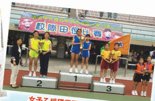
女子乙組獲得團體冠軍。