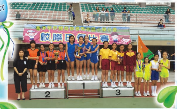
女子甲組勇奪接力賽冠軍。