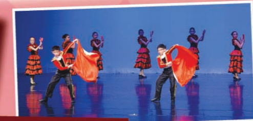
高年級西方舞的西班牙舞喜獲甲級獎；而牛仔舞及查查查亦獲乙級獎