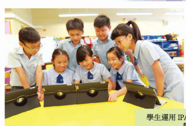
學生運用 IPAD 內的腦圖進行常識科的趣味學習活動。