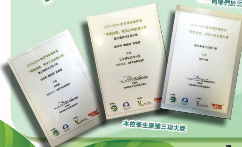
本校學生榮獲三項大獎