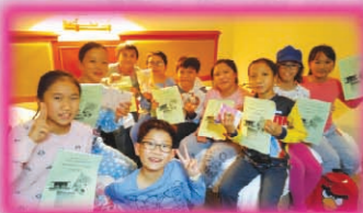
同學與領隊老師進行反思會，分享活動的喜與樂。

透過今次梅州之旅，學生不但親身體驗到當地風土人情，而且還感受到居民純樸生活的一面，實為難能可貴。