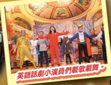
英語話劇小演員們載歌載舞。