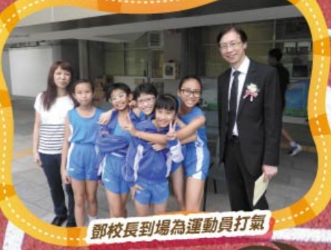
鄧校長到場為運動員打氣