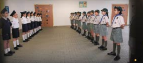
基督少年軍及童軍列隊接待來賓