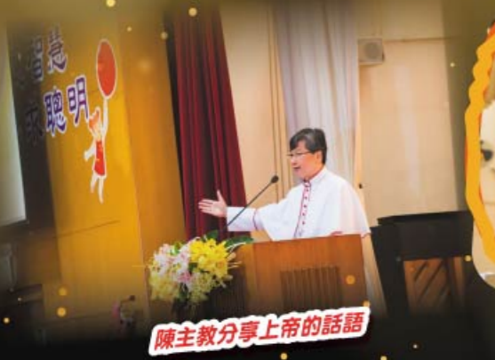
陳主教分享上帝的話語