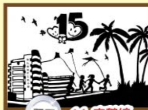
亞軍 4A 李懿婷