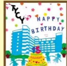
冠軍 4E 李巧琳