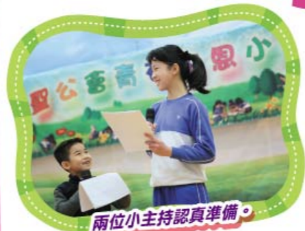
兩位小主持認真準備。