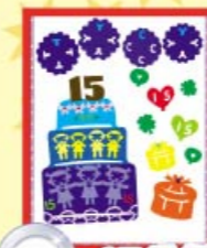
亞軍 1E 吳卓賢