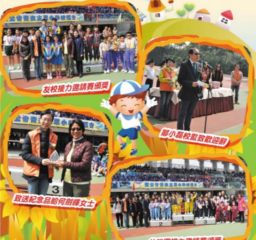
友校接力邀請賽頒獎

十五周年校運會能夠圓滿完成，實在感謝教師團隊及家長義工團隊的協助，期望運動會能推動學生更積極參與運動，鍛煉身體，並享受運動的樂趣。