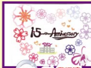
亞軍 5A 黎深潼