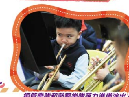
銅管樂隊和敲擊樂隊落力準備演出。