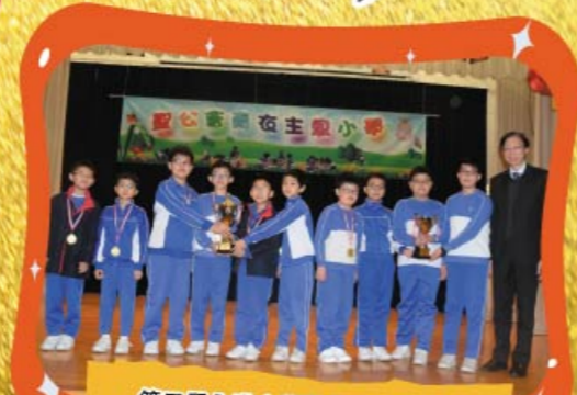
第三屆全港小學數學挑戰賽決賽 小五組團體冠軍及小六組團體季軍