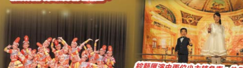
中國舞隊的表演十分精彩，就如她們身上的舞衣一樣，發出耀眼的光芒。