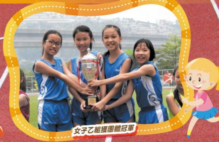
女子乙組獲團體冠軍