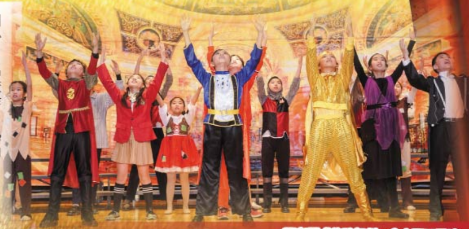
百老匯式的歌舞劇，令人再三回味

英語話劇組同學積極參與校內及校外話劇演出，包括香港青少年協會主辦的「恆生青少年舞台2016」--《時光倒流香港地》。此外，本年度英語話劇組把《快樂王子》改編成同名話劇《The Happy Prince》，並於「香港學校戲劇節2016/2017」比賽中獲得「傑出合作獎」，當中四位演員更榮獲「傑出演員獎」。同學們每次的演出均投入認真，透過精煉純熟的對白及活力澎湃的歌舞，深刻地將話劇的內容演繹，並將當中的故事信息傳遞給觀眾。