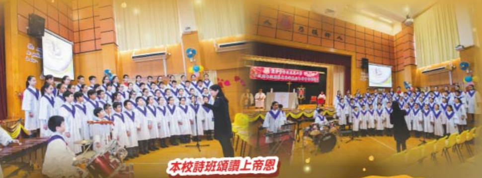
本校詩班頌讚上帝恩