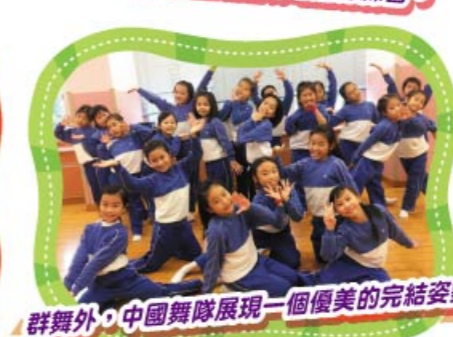
群舞外，中國舞隊展現一個優美的完結姿勢。