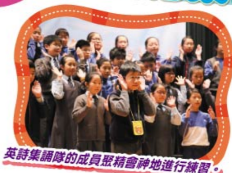
英語集誦隊的成員聚精會神地進行練習。