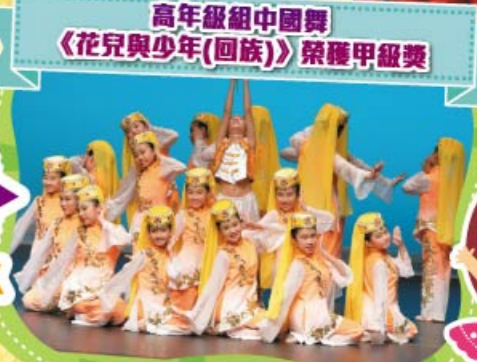
高年級組中國舞《花兒與少年(回族)》榮獲甲級獎