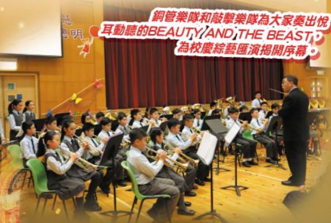
銅管樂隊和敲擊樂隊為大家奏出悅耳動聽的BEAUTY AND THE BEAST，為校慶綜藝匯演揭開序幕。