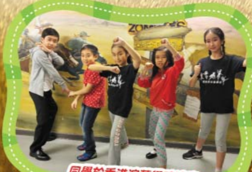
同學於香港演藝學院演出 恆生青少年舞台2016《時光倒流香港地》