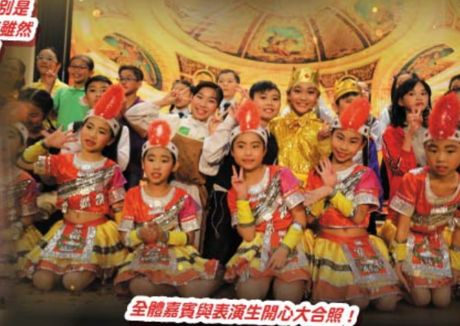
全體嘉賓與表演生開心大合照！