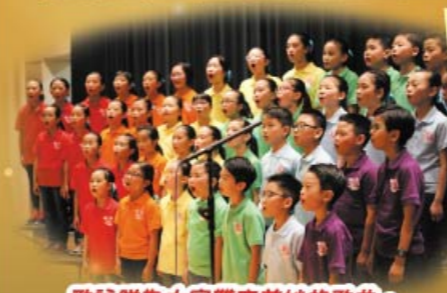
歌詠隊為大家帶來美妙的歌曲。