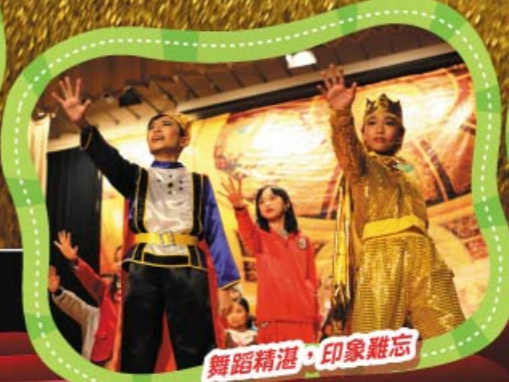
舞蹈精湛，印象難忘