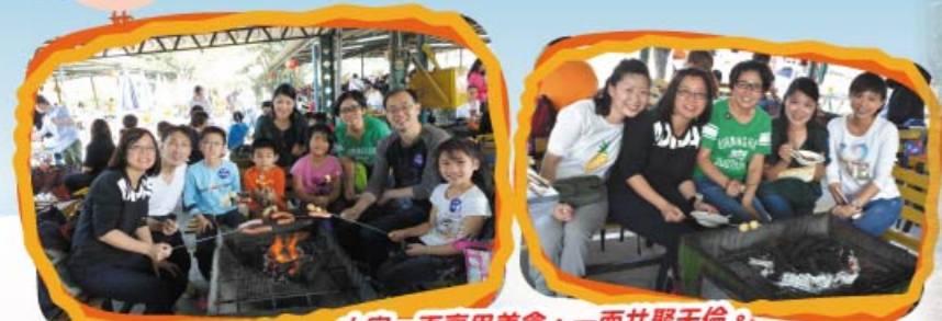
大家一面享用美食，一面共展天倫