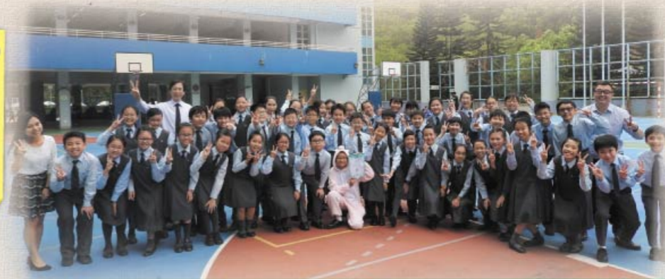
本校英文朗誦隊奪得隊際比賽冠軍，師生們賽後頓感興奮萬分。

A well-disciplined entry. This was a most imaginative interpretation and the choir worked with focus and enthusiasm. A most impressive pig. Very well staged and presented. A most enjoyable performance.