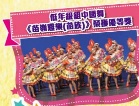
低年級組中國舞《苗嶺雜樂(苗族)》榮獲優等獎

本校舞蹈組在第五十三屆學校舞蹈節表現卓越，其中中國舞低年級組以《苗嶺雜樂(苗族)》參賽，榮獲低年級組中國舞(群舞)優等獎，獲各位評判高度讚賞；而高年級組以《花兒與少年(回族)》參賽，亦榮獲高年級組中國舞(群舞)甲級獎。此外，西方舞組的以色列舞《天與地》同樣喜獲甲級獎。在體育舞蹈方面，本校亦獲得查查組別之乙級獎。同學在不同的舞蹈比賽中的全情投入，靈活合拍，以優美流暢的舞姿展現舞蹈藝術的精彩，實在值得讚賞！