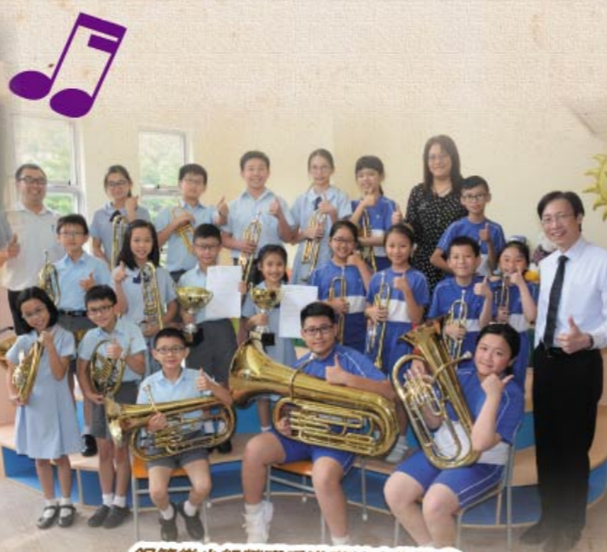
銅管樂小組榮獲香港聯校音樂協會「聯校音樂大賽2017」兩項金獎佳績