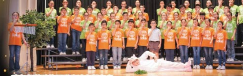
高年級英詩集誦隊表演有聲有色