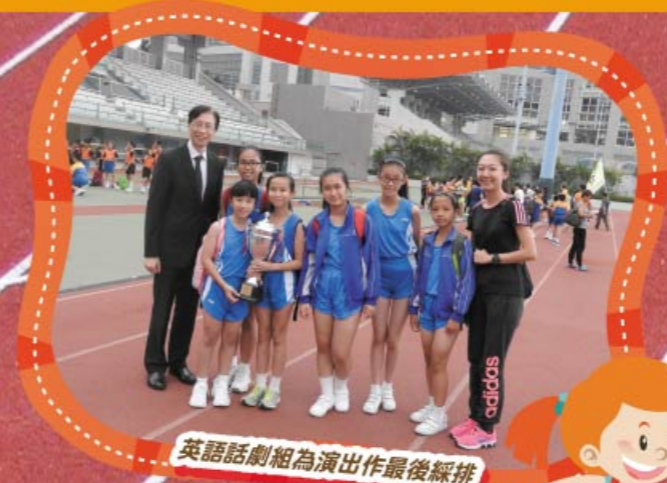
英語話劇組為演出作最後綵排

輝煌成績的背後，實有賴各方面的配合及支持方能達成。感謝全體體育科老師每天不辭勞苦地提升運動員的能力，無論在運動技巧上、體能上和合作上皆提供了專業的訓練。為了提升運動員的比賽狀態，教練使用平板電腦拍攝運動員訓練時的動作，讓教練和運動員觀看片段，藉以糾正錯誤的姿勢，使運動員循序漸進地掌握不同項目的比賽技巧，得以發揮他們的潛能。比賽時，教練也會臨場為運動員分析比賽最新的資訊，讓他們明白比賽的策略，並為運動員作出心理輔導，減輕因比賽帶來的壓力，有效地激發運動員的鬥志，使他們得以達到比賽的目標。當然，同學們艱苦訓練、老師的耐心教導和家長全力支持是比賽成功的原因。