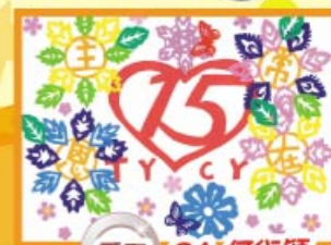
季軍 6A 何衍穎