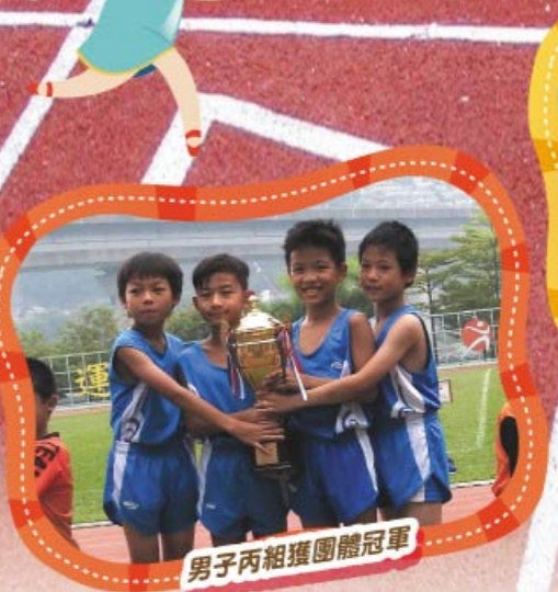
男子丙組獲團體冠軍