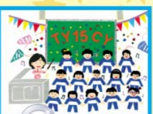
亞軍 3E 周浚豐