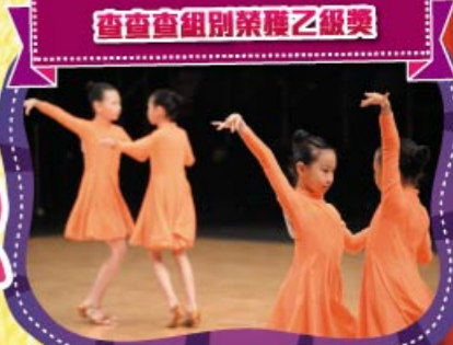
查查組別榮獲乙級獎