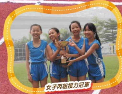
女子丙組接力冠軍