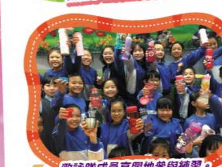
歌詠隊成員高興地參與練習。