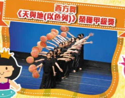
西方舞《天與地(以色列)》榮獲甲級獎