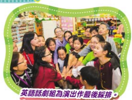
英語話劇組為演出作最後綵排。