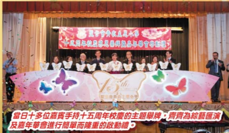
當日十多位嘉賓手持十五周年校慶的主題舉牌，齊齊為綜藝匯演及嘉年華會進行簡單而隆重的啟動禮。

為了慶祝本校創立十五周年，負責的老師們早在去年十月已經開始籌備這次的綜藝匯演。經過多個月來的用心籌備以及同學們的努力，我們終於把整個綜藝匯演圓滿地向大家呈現。當日除了數百名家長及學生到校欣賞表演外，還有逾一百位嘉賓蒞臨本校，而參與的表演生接近二百人，表演隊伍包括銅管樂隊、敲擊樂隊、英詩集誦隊、英語話劇組、歌詠隊及低年級中國舞隊。表演生們連場好歌勁舞、精彩的演繹，同學們演出認真、投入和自信，完全表現出聖公會青衣主恩小學學生充滿自信與毅力的一面，來賓均稱讚他們表現得十分出色。