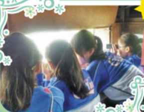
老師帶領40位環保大使到米埔自然保護區，由保護區的職員帶領導賞活動，認識不同候鳥的習性以及保育方法。