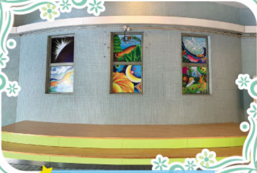
位於地下雨天操場的舞台

學校不斷美化環境與完善設備，務求為師生提供最理想的學習環境。本年度分別於雨天操場增設舞台及五樓裝置大型獎盃櫃。新建設的舞台配以雙台階設計，可為師生提供一個額外的表演及拍攝場地，讓師生善用雨天操場的空間，另外，由於近年學生積極參與各項比賽，取得的獎項和獎盃數量日增，有見及此，學校於五樓大堂加設一個大型獎盃櫃，可以更全面地展示學生為校爭光之成果。