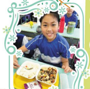
逢星期一，午膳供應商提供一款無肉膳食。同學及老師均會自備餐具，不用即棄塑膠餐具。