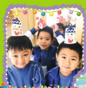
同學們戴上親手設計而又色彩繽紛的聖誕帽和用動物造型杯子盛載爆谷，真高興啊！