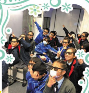
同學於環保車上觀看4D電影，及使用有趣的平板電腦應用程式學習環保知識。