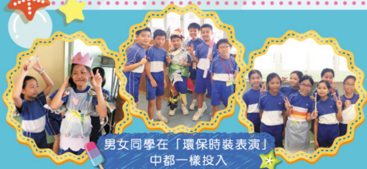
男女同學在「環保時裝表演」中都一樣投入

本校一直致力為同學們打造一個豐富的英語學習環境，而英語夏令營正好為他們提供一個與外籍人士接觸溝通的學習機會。過去幾年，學校多次從英國邀請一些主修教育系的大學生或畢業生到校為同學們提供英語夏令營活動，感恩這活動一直受到家長支持，視為難得的學習機會，故此每次均有過百名同學參與。期望日後有更多同學能透過英語夏令營得著造就及成長。