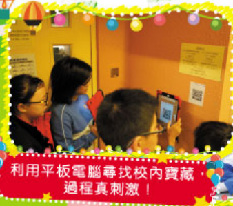
利用平板電腦尋找校內寶藏過程真刺激！

同學們當天均積極參與各項活動，全程投入在豐富的英語學習環境中。感謝老師們和家長的協助和辛勞付出。希望同學們能繼續享受學習，熱愛英語。