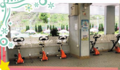
同學透過踏單車，提供電源給連接着的小風扇，讓同學可以在踏單車過程中享受涼風。