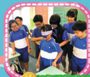
在「你說我聽」活動中有我們來為你引路！聽我們的就好了！