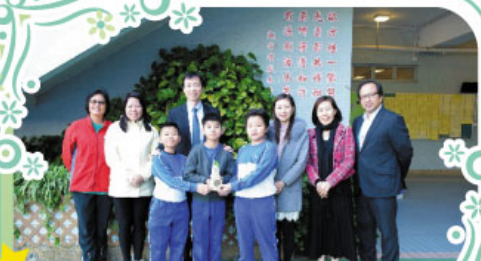
本校榮獲「第17屆香港綠色學校獎」(小學組)綠色學校銅獎