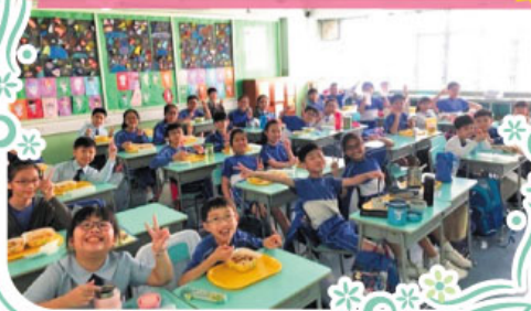
午飯時候熄燈1小時，利用日光照明之下進行午膳。