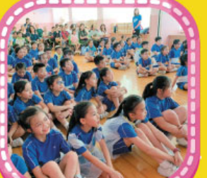
夏令營畢業禮上，家長見證了同學們的學習成果