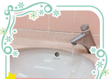
於全部課室及洗手間水龍頭裝上節水器，以減少水龍頭出水量，從而減少用水。