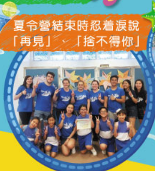
夏令營結束時忍着淚說「再見」，「捨不得你」