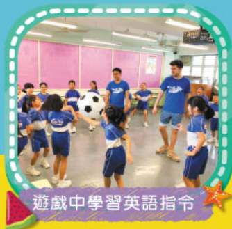
遊戲中學習英語指令