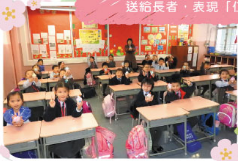
一年級學生在多元智能課製作「毛巾蛋糕」送給長者，表現「仁愛」精神。

計劃以「仁愛」、「堅毅」、「喜樂」、「創意」、「社交智慧」、「熱情」、「正直」及「感恩」為一年級至三年級的品格內涵發展主題。透過繪本故事為品格培育之媒介，設計相關之「品格生活課」，並把課程列入本校之生活教育課中。課堂內容包括故事講解及分享、體驗活動，如角色扮演、體驗遊戲和生活分享。每次課堂完結時均有延伸學習，讓學生與家長在品格學習之課題上共同研習。