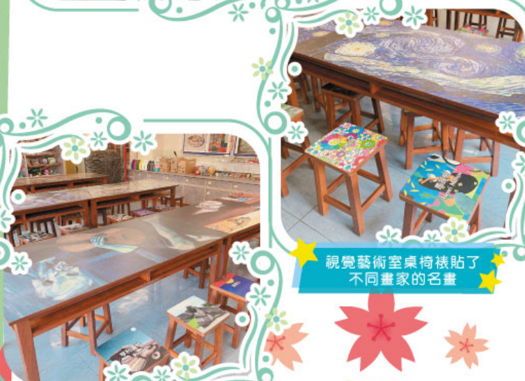
視覺藝術室桌椅裱貼了不同畫家的名畫