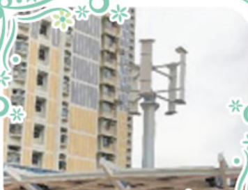
太陽能風能發電系統設於地下及七樓。