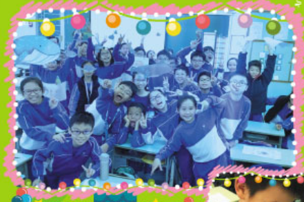
能在擴充實境中與魚兒暢泳真難忘！