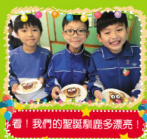
看！我們的聖誕馴鹿多漂亮！