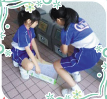
各樓層放置三個廢物回收箱供師生們使用。