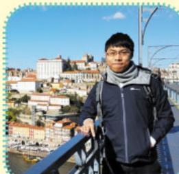
於葡萄牙波圖進行交流活動

負笈英國倫敦政治及經濟學院(London School of Economics and Political Science) 修讀法律本科的三年轉瞬即逝, 當中許多點滴均難以忘懷。英國的學習文化和節奏, 與我在香港讀中學的經歷大大不同。三年來, 我認識了來自五湖四海的朋友, 也到了歐洲各地交流及遊覽, 深入體驗各種文化, 確實是眼界大開。唯一的遺憾是因疫情影響取消了畢業禮而未能畫上圓滿句號。展望將來, 我有幸獲得牛津大學及哈佛大學法學系取錄, 修讀碩士課程, 希望可以藉此良機, 繼續深造法律知識, 比較兩地的法律文化和政策, 並與同儕、教授互相交流意見。我相信留學的經驗不但予我機會接觸不同背景的人, 建立批判思考能力, 更重要的是豐富了人生體驗, 待學成歸來時, 能更好地回饋社會。