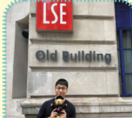
攝於英國倫敦政治及經濟學院正門前