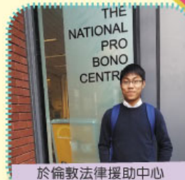
於倫敦法律援助中心擔任義工, 負責處理案件