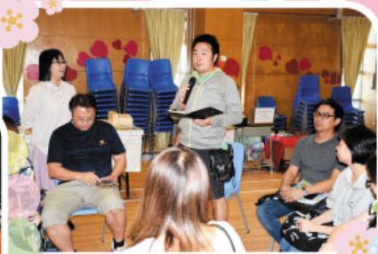
一年級家長踴躍出席工作坊，學習親子伴讀的技巧。