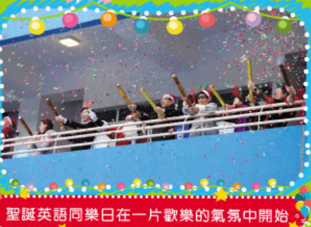
聖誕英語同樂日在一片歡樂的氣氛中開始。