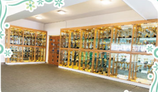
位於五樓大堂的大型獎盃櫃，展示了百多個獎盃。

學校不斷美化環境與完善設備，務求為師生提供最理想的學習環境。本年度分別於雨天操場增設舞台及五樓裝置大型獎盃櫃。新建設的舞台配以雙台階設計，可為師生提供一個額外的表演及拍攝場地，讓師生善用雨天操場的空間，另外，由於近年學生積極參與各項比賽，取得的獎項和獎盃數量日增，有見及此，學校於五樓大堂加設一個大型獎盃櫃，可以更全面地展示學生為校爭光之成果。