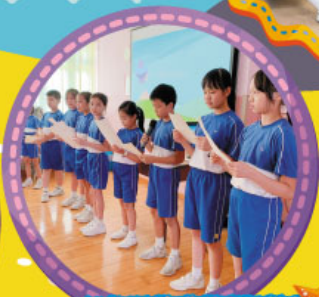
同學們分享心聲，大家都聽得感動！