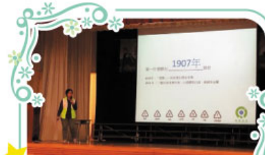
講者於「塑膠之城」講座中教導同學減少使用塑膠產品的方法，並講解塑膠產品對地球帶來之禍害。