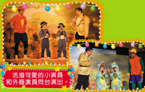
活潑可愛的小演員和外籍演員同台演出。