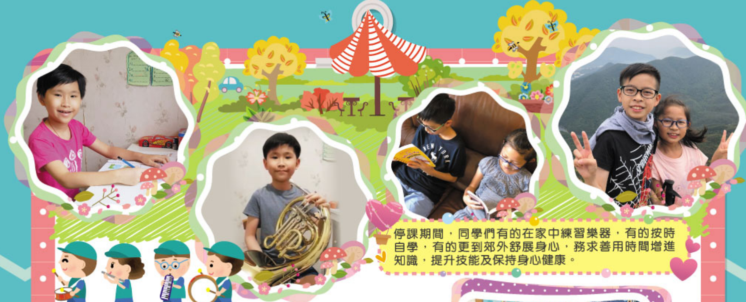
停課期間，同學們有的在家中練習樂器，有的按時自學，有的更到郊外舒展身心，務求善用時間增進知識，提升技能及保持身心健康。