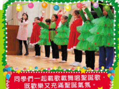
同學們一起載歌載舞唱聖誕歌，既歡樂又充滿聖誕氣氛。