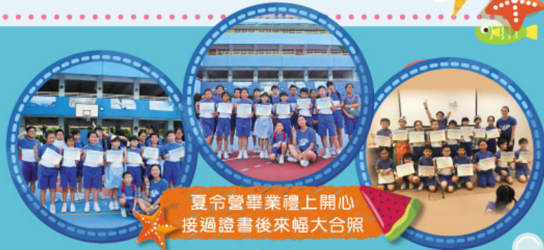
夏令營畢業禮上開心接過證書後來幅大合照