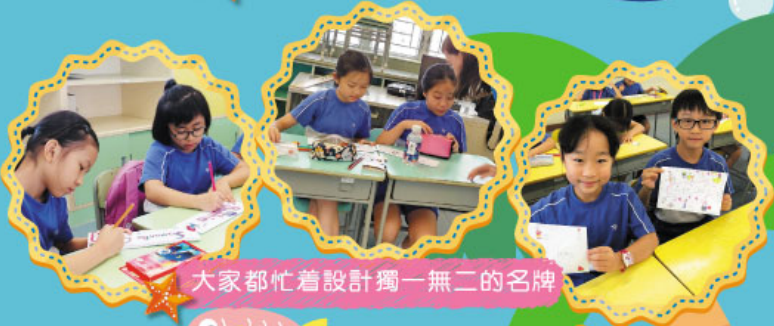
大家都忙着設計獨一無二的名牌