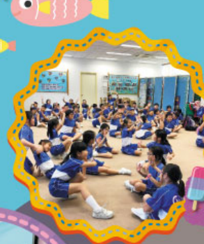
到處都是笑聲！每一刻都珍貴難忘！