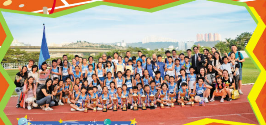
運動員、家長及教師大合照