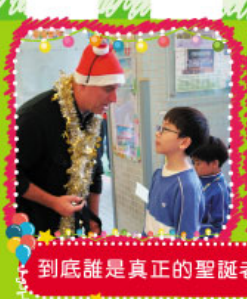
到底誰是真正的聖誕老人呢？