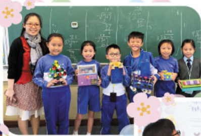
二及三年級學生在「創意」課堂自製環保玩具，發揮創意。