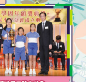
香港學界體育聯會 青衣區小學總錦標男子組金獎