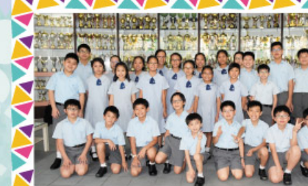
敲擊樂隊榮獲第70屆香港學校音樂節 敲擊樂高級組季軍及聯校音樂大賽2018 敲擊樂團(小學組)金獎