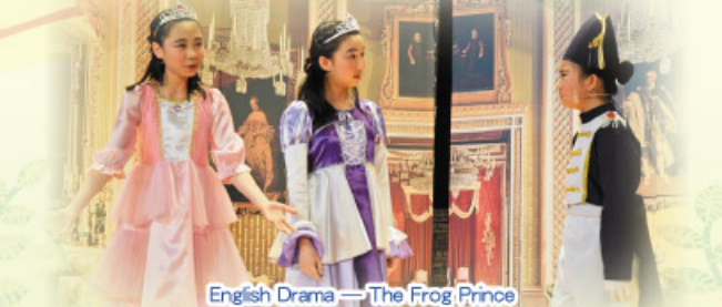
English Drama — The Frog Prince