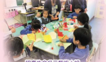
照亮生命多元藝術小組

本校成功申請「家校合作津貼」，舉辦優質家長進修課程，如「16型人格提升學習效能」、「非暴力溝通——愛語聆聽，關係滋養」及「親子關係從減壓開始之中醫談減壓」等。