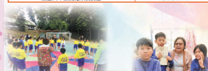
成長的天空日營的彩虹傘活動