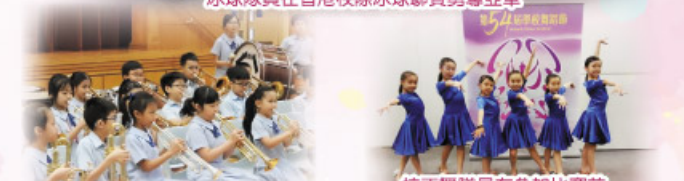
銅管樂隊員在年度音樂會表現出色