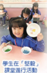
學生在「堅毅」課堂進行活動

本年度在一年級開始推行「親親孩子說故事」——學生品格培育及生命成長校本計劃。本計劃是由本校與聖雅各福群會 Rachel Club 及宗教教育中心合辦。期望以正向心理學之「品格內涵」為發展目標，培育初小級學生發展正向品格，從而達致生命成長，建立正面的人生觀。