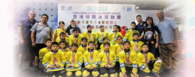
冰球隊員在香港校際冰球聯賽勇奪亞軍

體育方面： 跆拳道、足球、乒乓球、羽毛球、劍擊、游泳、冰上曲棍球、醒獅及競技體操等。