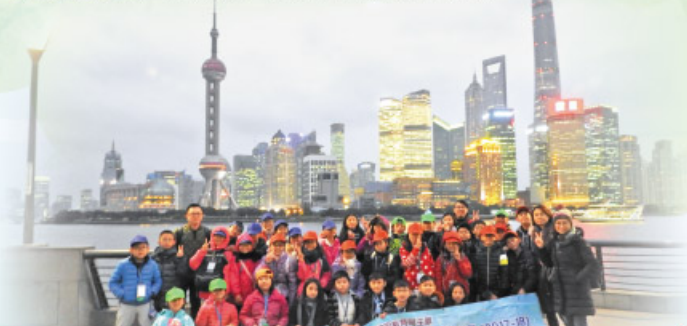
五年級44位師生到上海進行歷史及科技探索之旅，師生們在上海外灘留影。

為了擴闊學生的學習視野，本年度舉辦了「上海歷史及科技探索之旅」，目的是讓學生認識上海的歷史、文化和古今中外的建築，了解上海在過去一百年間的變遷；認識上海的科技發展，了解科技與日常生活的關係。同時也藉此提升了學生的自學能力、社交能力和自理能力。