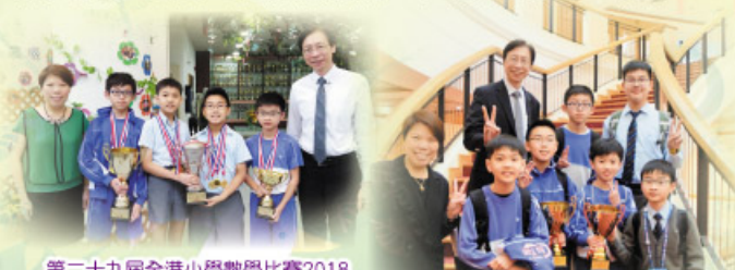
第二十九屆全港小學數學比賽2018 獲得全港冠軍、教協盃全場總冠軍及 新界西分區冠軍

此外，本校亦鼓勵學生多參與校內、校外以及國際性的數學比賽，透過互相切磋激發學生潛能，擴闊學生視野。