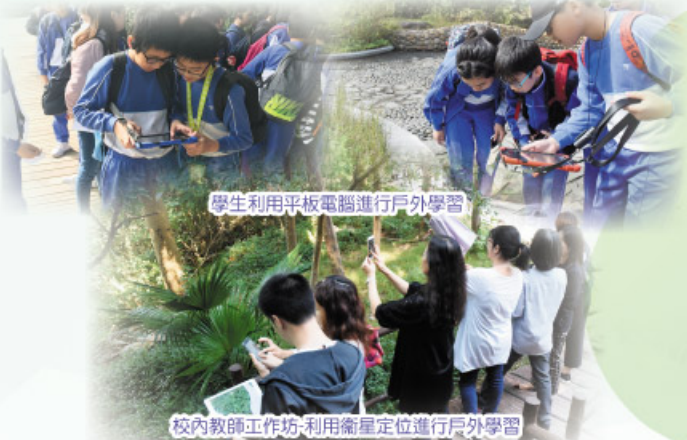
學生利用平板電腦進行戶外學習

由於過去3年成功推行自攜平板電腦進行電子學習，教育局也邀請本校老師分享BYOD在學校推行的策略，讓其他學校作為發展長遠電子學習部署的參考。