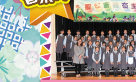
合唱團榮獲第70屆香港學校音樂節 低級組合唱團比賽(教堂音樂)冠軍