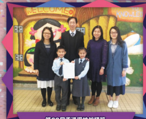
第69屆香港學校朗誦節 小學三、四年級粵語散文集誦榮獲亞軍