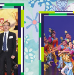
高年級中國舞隊(魚趣) 榮獲第54屆學校舞蹈節比賽「優等獎」