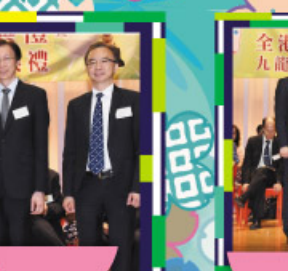
香港學界體育聯會 青衣區小學總錦標女子組金獎