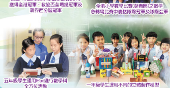
五年級學生運用Pad進行數學科 全方位活動