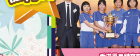
香港學界體育聯會 青衣區小學總錦標女子組十連冠金獎