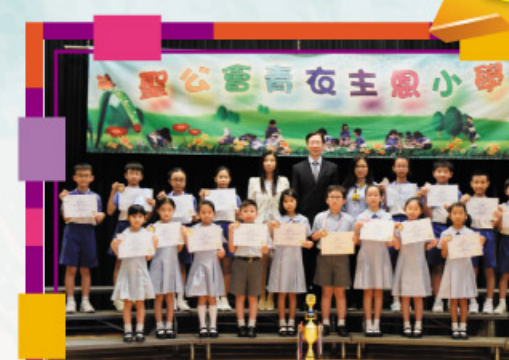
2017「活現真我」繪畫比賽(亞太區)勇奪學校組亞軍、 兒童組一等獎2名、二等獎2名、三等獎4名 少年組一等獎3名、二等獎9名、 三等獎5名的佳績及優異獎3名