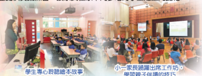
學生專心聆聽繪本故事

此外，本校特別為一年級家長舉辦了兩次工作坊，讓家長認識品格培育的理念架構及品格內涵，從而關注學生的品格成長及發展需要。工作坊也教授家長有關繪本選書及親子伴讀的技巧，並提供實踐練習，讓家長在家中同步培育學生之正向品格。