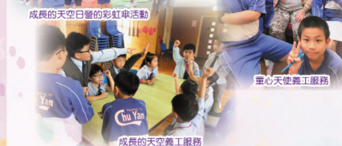
童心天使義工服務