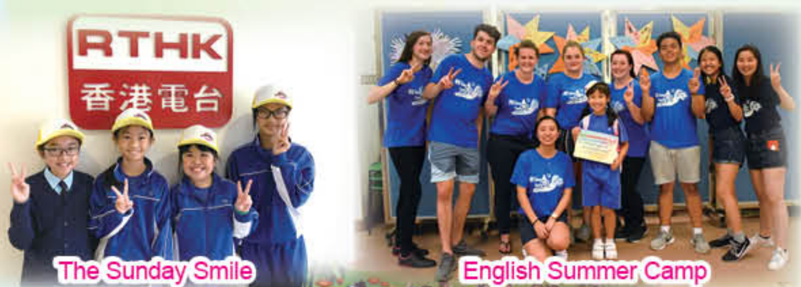
The Sunday Smile

為了讓學生在豐富的語言環境下將已有的知識活學活用，本年度舉辦了多元化的英語活動，如「English Summer Camp」、「Reading Wonderland Activities」、「Lunchtime Speaking Activities」、「Creative Writing Competition」、「Comic Strip Writing Competition」等。為擴闊學生對英語世界熱門話題的認識、加強師生互動交流及營造最佳的語境，本年度亦出版了兩份內容豐富的科本刊物「TYCY Smarties」。