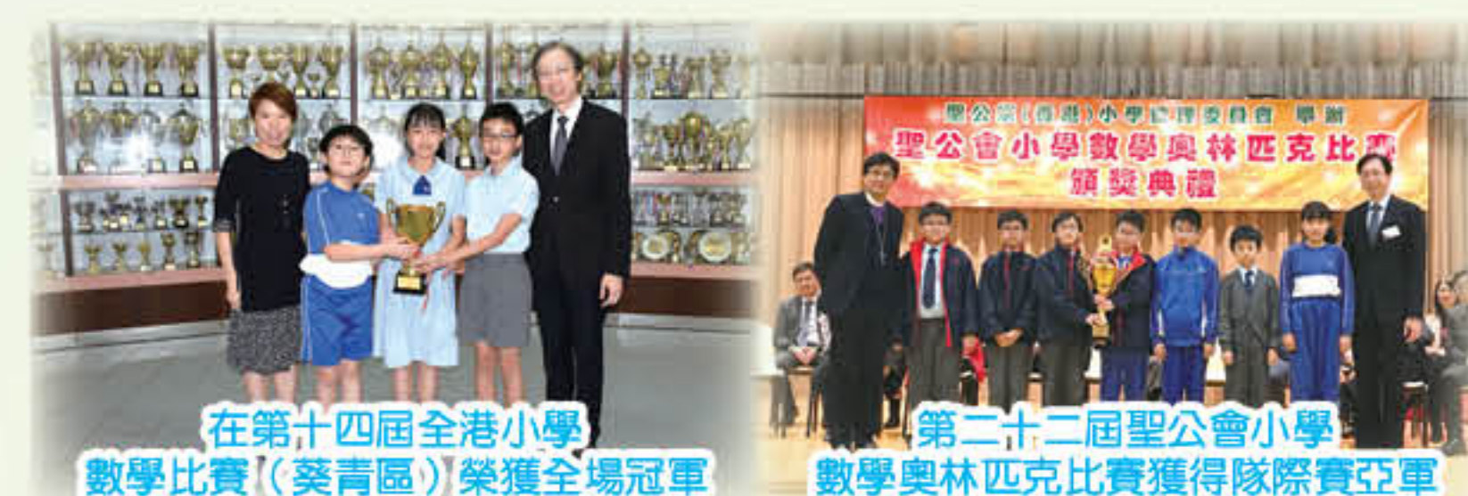
在第十四屆全港小學數學比賽(葵青區)榮獲全場冠軍

本年度優化了校本解難課程，按照學生的能力把二至四個解難課程統整為高階及進階解難課程。課堂上老師以難題「設疑」，讓學生經歷「釋疑」和「解疑」的學習過程，透過有效的提問，引導學生掌握不同的解難策略，包括繪圖、列表、試誤、找規律、逆向思維及窮盡可能性等，從中發現數學的奧秘及享受解難的樂趣。