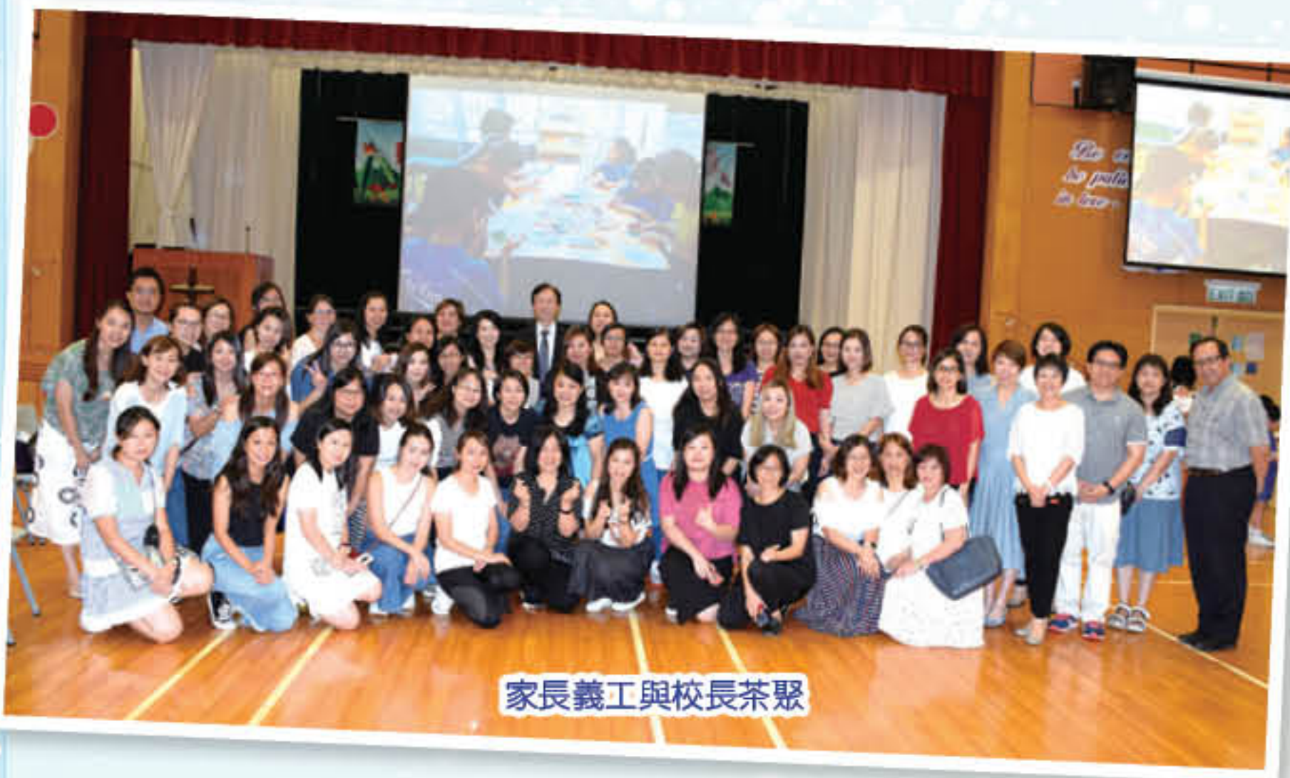
家長義工與校長茶聚