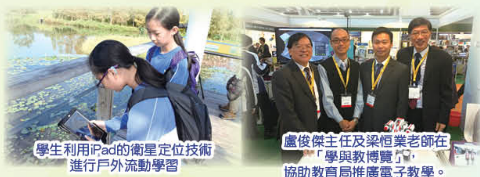
學生利用iPad的衛星定位技術進行戶外流動學習

本年度學校更成為CoolThink@JC的創新社群學校，推動運算思維教育，於電腦科加入有系統的編程課程，讓學生透過「To Play, To Learn, To Code」的學習模式，提升他們的編程及解難技巧，為學習STEM課程作好準備。