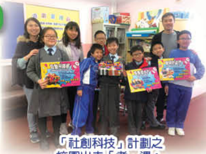
「社創科技」計劃之校園出走「耆」遇：為社區各階層人士設計所需物品

「全方位學生輔導服務」是「校風及學生支援」範疇中的一項，為配合學生的成長需要，學校社工與校內不同的功能小組合作，共同設計及推行各類發展性及預防性活動，協助學生面對成長路上的各項挑戰。