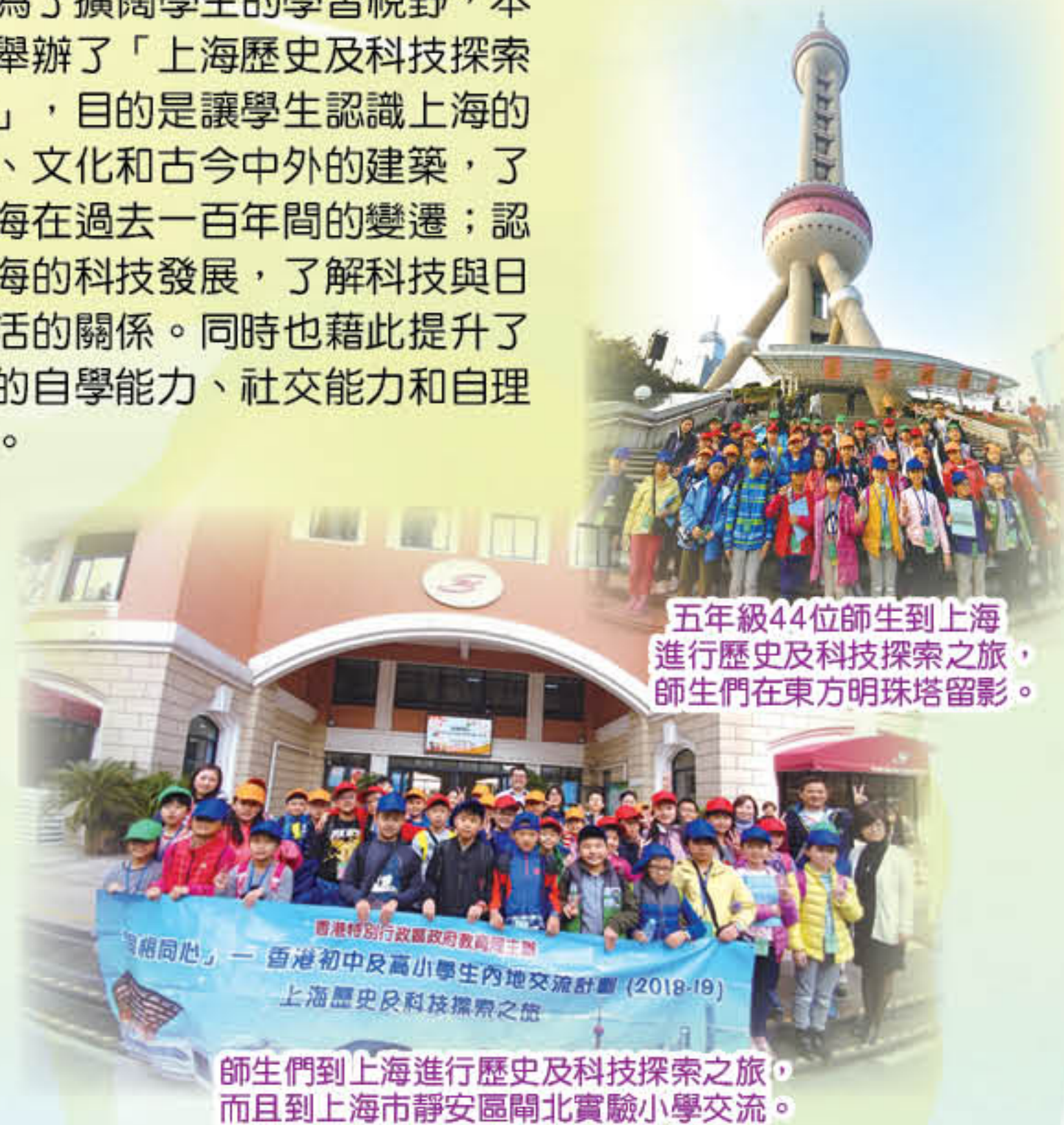
五年級44位師生到上海進行歷史及科技探索之旅，師生們在東方明珠塔留影。

為了擴闊學生的學習視野，本年度舉辦了「上海歷史及科技探索之旅」，目的是讓學生認識上海的歷史、文化和古今中外的建築，了解上海在過去一百年間的變遷；認識上海的科技發展，了解科技與日常生活的關係。同時也藉此提升了學生的自學能力、社交能力和自理能力。