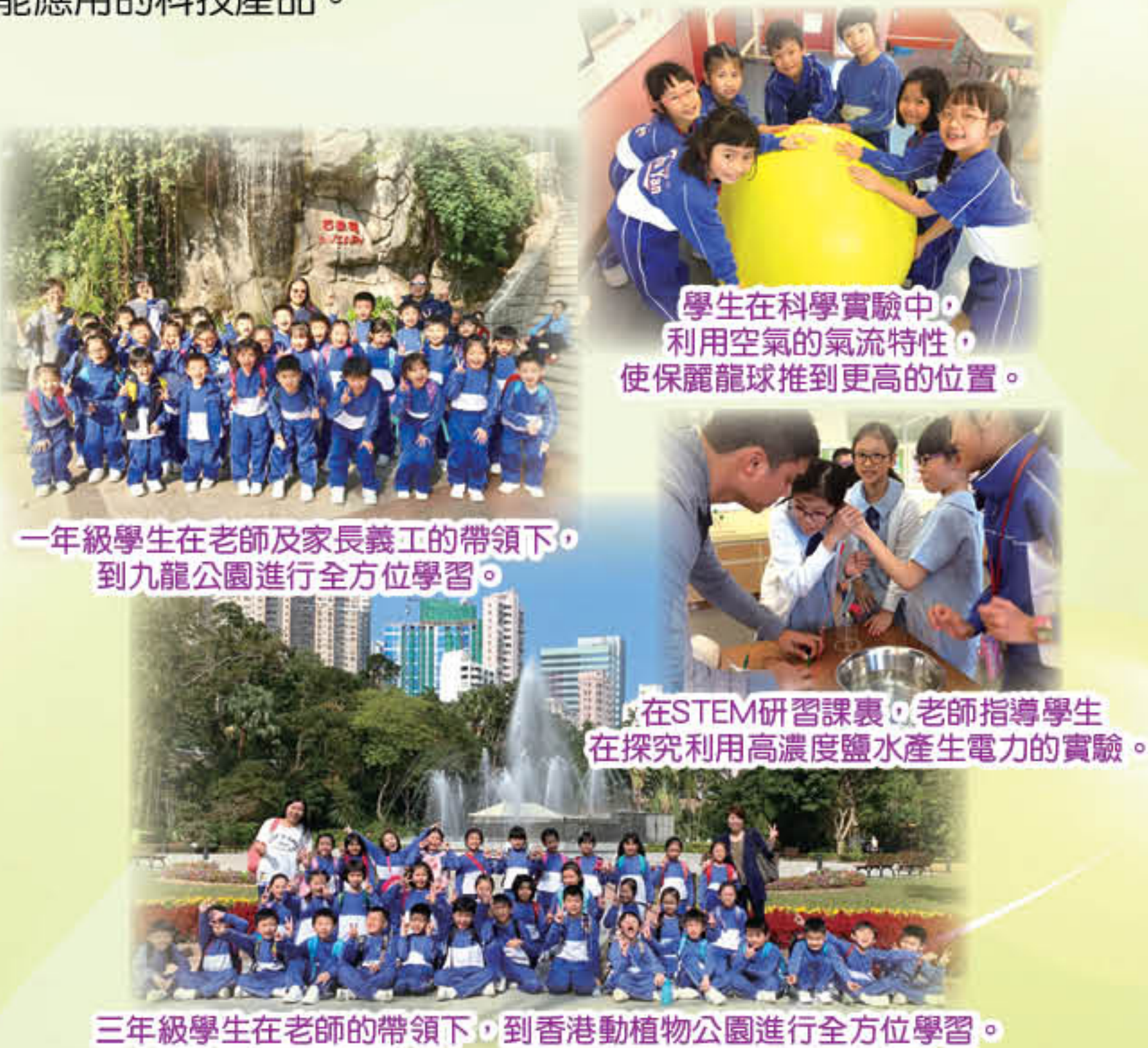
一年級學生在老師及家長義工的帶領下，到九龍公園進行全方位學習。

此外，常識科亦推行校本STEM教育，從而培養學生的學習興趣、提升解難能力、發展創新及邏輯思維。課程設計著重學生從預測、觀察、解釋中學習，並透過多元化實驗，建構學生科學知識及探究精神，在學習過程中強調認知及體會，同時亦鼓勵學生將學到的知識付諸應用，發揮創意，自行創作可在現實生活中能應用的科技產品。