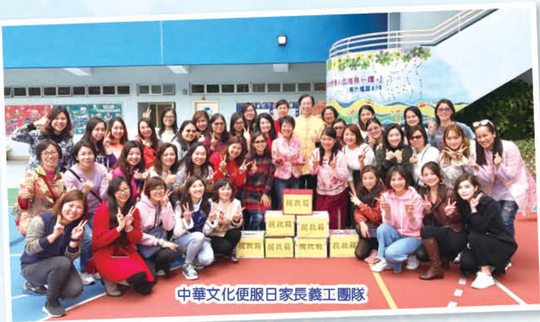
中華文化便服日家長義工團隊

家長教師會是學校的忠誠伙伴，並積極發揮家校之間的橋樑作用，本年度在家教會的協助下，學校舉辦了「闔家歡聚樂悠遊」大旅行及多項親子興趣班。本校家長義工隊陣容鼎盛，亦積極投入各項學校義務工作，當中包括校運會、「校服回收顯關懷」、「中華文化便服日」活動、各科組學習活動、家長閱讀大使、午膳爸媽及家長興趣班導師等，大大促進了家校之間的情誼及合作精神。