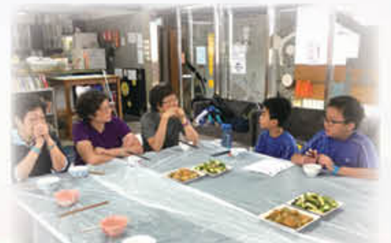
「愛·連繫」正向服務計劃：與老友記有個約會

透過參加聖公宗(香港)小學監理委員會屬校學生輔導主任及聖公會小學輔導服務處舉辦之聖公宗小學「生命、心靈及價值教育」之「接納關懷愛同行」聯校家長講座暨家庭立願禮及親子活動，促進親子關係。此外，本校運用「家校合作津貼」舉辦多項優質家長進修課程，如：「家校齊減壓」、「正向情緒有妙法」、「試出狀元來」、「中英聯合記憶」及「幸福教育：情緒的藝術」等，家長均踴躍參與。