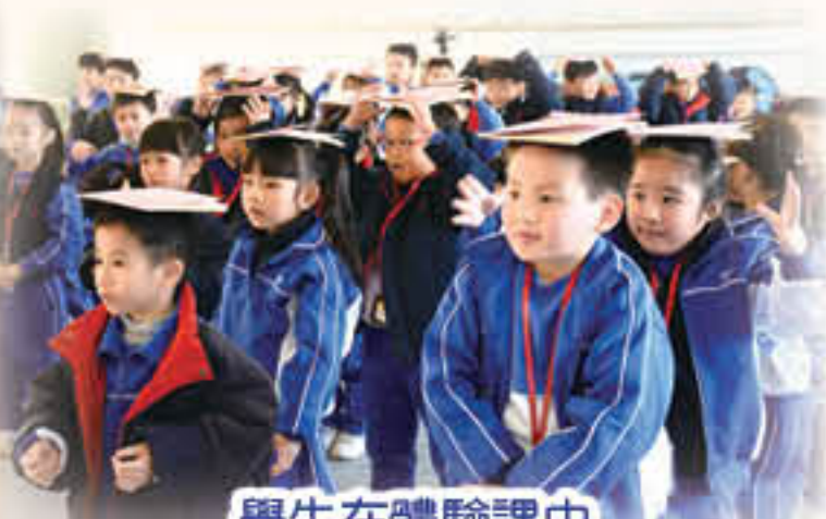
學生在體驗課中堅毅地完成各項挑戰。