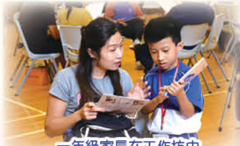
一年級家長在工作坊中學習親子伴讀的技巧。

此外，本校特別為一年級家長舉辦了兩次工作坊，讓家長認識品格培育的理念架構及品格內涵，從而關注學生的品格成長及發展需要。工作坊也向家長提供有關繪本選書及親子伴讀之技巧，並提供實踐練習，讓家長在家中同步培育學生之正向品格。