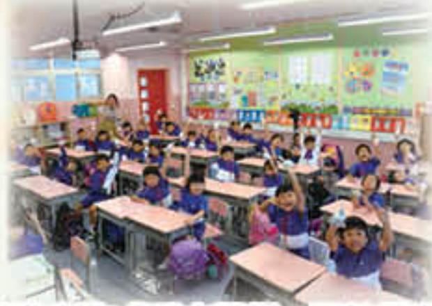
學生製作「毛巾蛋糕」送給長者，表現「仁愛」精神。

本年度一至二年級推行「親親孩子說故事」——學生品格培育及生命成長校本計劃。本計劃是由本校與聖雅各福群會 Rachel Club 及宗教教育中心合辦，而其中一年級計劃更獲得優質教育基金資助發展。