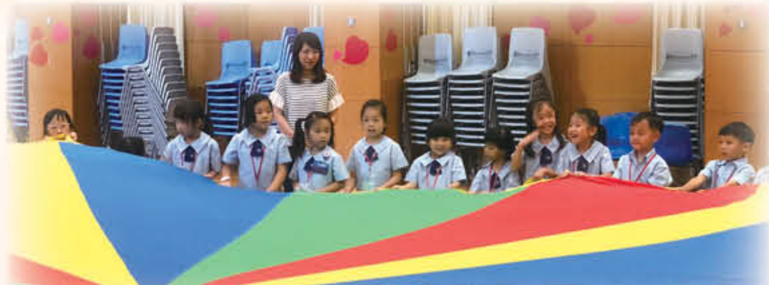
小一迎新及適應活動：「童做好朋友」

本校申請「區本課後學習及支援計劃」及「校本課後學習及支援計劃」津貼，為一至六年級部份學生推行課後功課輔導班及多元化的興趣班，拓展潛能。本年度更有三名學生被邀請與屬校學生參加由聖公會(香港)小學監理委員會有限公司之〈春雨〉舉辦的境外學習活動「邊拍邊畫邊賞·沖繩遊」，認識不同地方的藝術文化，寓學習於遊歷中。