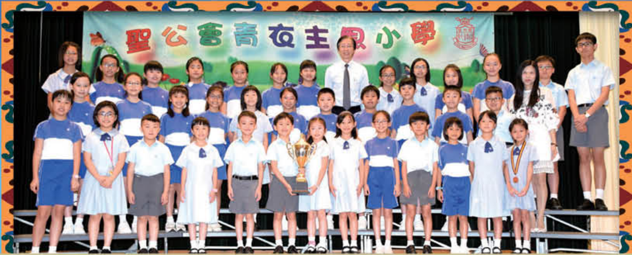
2019「夢想·家」國際繪畫比賽勇奪學校組冠軍、 冠軍1名、一等獎6名、二等獎15名、三等獎11名及優異獎12名