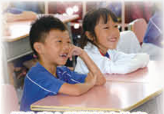
學生專心聆聽繪本故事。

本校期望透過此計劃，從初小級開始，逐步在校內建立一套有系統的正向教育及品德培育課程，藉此提升學生身、心、靈之健康，建立正面的人生觀。