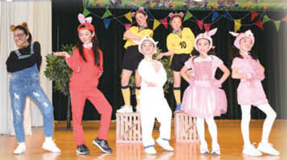
English Drama – Tortoise and Hare