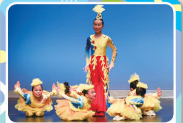
本校中國舞高年級組榮獲第56屆學校舞蹈節（群舞）《歡樂金雀》甲級獎