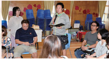
一年級家長踴躍出席工作坊，學習親子伴讀的技巧。

本年度一至三年級推行「親親孩子說故事」——學生品格培育及生命成長校本計劃。本計劃是由本校與聖雅各福群會 Rachel Club 及宗教教育中心合辦，而二年級的計劃更獲得優質教育基金資助。