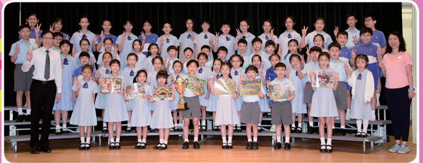
本校學生榮獲ICEHK舉辦的「伴我同行」國際繪畫比賽學校組冠軍、一等獎7名、二等獎16名、三等獎21名及優異獎15名