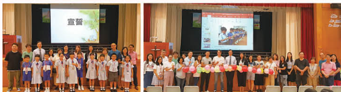
小四「成長的天空」計劃(小學)啟動禮

「全方位學生輔導服務」是「校風及學生支援」範疇中的主要一環，為配合學生的成長需要，學校社工與校內不同的功能小組合作，共同設計及推行各類發展性及預防性活動，協助學生面對成長路上的各項挑戰。