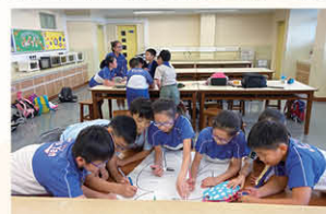
香港聖公會福利協會及華人永遠墳場 管理委員會贊助舉辦 「愛·連繫」朋輩輔導培訓計劃

透過參加聖公宗(香港)小學監理委員會屬校學生輔導主任及聖公會小學輔導服務處舉辦之聖公宗小學「生命、心靈及價值教育」之「陽光燦爛喜樂心」聯校親子創作活動，促進親子關係。此外，本校運用「家校合作津貼」舉辦多項優質家長進修課程，如：「全腦教養法」、「正面管教：做個正能量的家長」、「夫妻關係與正向教養的秘訣」及「九型人格面面觀」等，家長均踴躍參與。