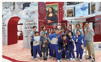
拔尖活動： 「想·像達文西500週年展」科技展覽