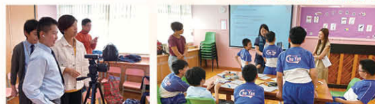
與香港遊樂場協會合辦「社創科技」小組