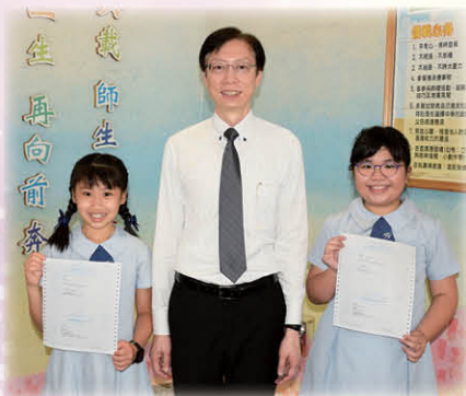
6A 胡泳彤獲派聖保祿學校 6A 周恩翹獲派協恩中學