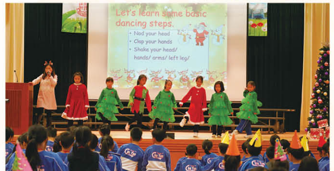
English Fun Day

為擴闊學生視野，英文科積極引入多元評估及比賽，如Pearson Tests of English、TOEFL Junior及各類比賽等，學生均取得理想成績。此外，本科亦積極推動學生於課餘時主動學習英語，亦引入適切的網上自學資源「Fun English Scheme」網上學習平台，希望學生養成自主學習的素質。