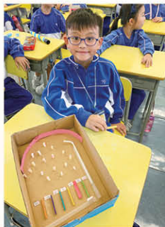
學生與家長一同製作環保玩具，發揮創意。