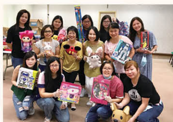
中華文化便服日家長義工團隊

家長教師會是學校的忠誠伙伴，並積極發揮家校之間的橋樑作用，本年度在家教會的協助下，學校舉辦了興趣班及家長講座。本校家長義工隊陣容鼎盛，亦積極投入各項學校義務工作，當中包括「校服回收顯關懷」、「校服義賣」、「中華文化便服日」活動、各科組學習活動、家長閱讀大使、午膳爸媽及家長興趣班導師等，大大促進了家校之間的情誼及合作精神。