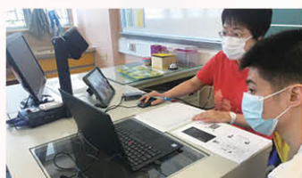
老師在停課期間，在學校與學生進行網上實時總結課。