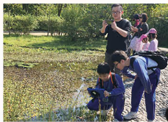
學生利用iPad的衛星定位技術進行戶外流動學習。

下學期因新冠肺炎疫情影響，學校被迫停課四個多月。在停課期間，教師運用不同的電子學習模式支援學生在家學習，如拍攝教學短片講解課文內容，讓學生可以在家中重溫學習重點。又透過電子學習管理平台 Google Classroom，發放電子學習資源，配合電子書讓學生在家進行自學。此外，教師更透過 Zoom 視像平台進行網上實時「視像總結課」，與學生總結在家中自學的單元，鞏固學生的所學，達到「停課不停學」的目標。教師在復課前設計網上評估，讓學生在 Google Classroom 內進行網上評估，有效記錄學生在家進行電子學習的情況，掌握學生在停課時的學習進度，以便復課後按需要調適教學計劃，保持學生的學習動力。