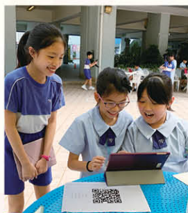
五年級學生運用 iPad、Google Forms 進行數學科全方位活動(方向)

本年度亦努力持續發展電子教學資料庫，並於各級推行電子教學協作觀摩，及發展六年級「立體圖形的截面」的單元電子教材，同時優化了五年級「面積(二)」、四年級「周界」、「面積」及「小數」這三套單元電子教材。教師運用電子工具，讓抽象的概念視覺化呈現，並以探究模式讓學生建構數學知識，有助提升學生解難能力及抽象思維能力。