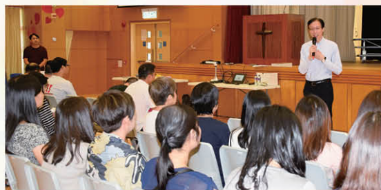
校長與教師分享推動正向教育的意義

學校課程發展組於本年度為教師安排了18項校本教師專業進修講座及分享會，由校外專家到校及本校教師分享不同教學專題。