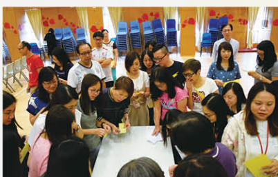
導師透過體驗活動讓教師認識成長心態