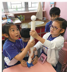
學生在探究的過程中，嘗試將發泡膠球懸浮在空中，看看他們多厲害！

此外，常識科亦推行校本STEM教育，從而培養學生的學習興趣、提升解難能力、發展創新及邏輯思維。課程設計著重學生從預測、觀察、解釋中學習，並透過多元化實驗主題，建構學生科學知識及探究精神，過程強調認知及體會。同時亦鼓勵學生將學到的知識付諸應用，發揮創意，自行創作可在現實生活中應用的科技產品。