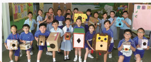
這是四年級同學精心設計的「空氣砲」，威力十足！

此外，常識科亦推行校本STEM教育，從而培養學生的學習興趣、提升解難能力、發展創新及邏輯思維。課程設計著重學生從預測、觀察、解釋中學習，並透過多元化實驗主題，建構學生科學知識及探究精神，過程強調認知及體會。同時亦鼓勵學生將學到的知識付諸應用，發揮創意，自行創作可在現實生活中應用的科技產品。