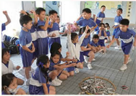
同學在體驗課中，以自製環保紙圈進行比賽。