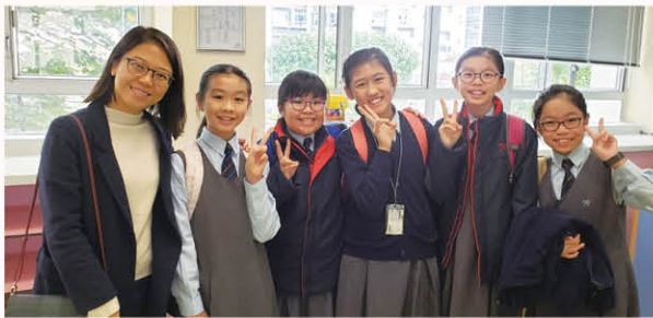
本校中文辯論隊榮獲小學文化盃辯論比賽季軍

另外，為提升學生的高階思維能力，中文科參與教育局中文科資優教育組伙伴學校計劃，為三至六年級語文尖子學生剪裁三個校本抽離式語文資優培訓課程，包括「詩韻頌——童心寫童詩」、「創意西遊記」及「辯論小組」，讓學生透過小組活動提升其批判思維和創意能力。