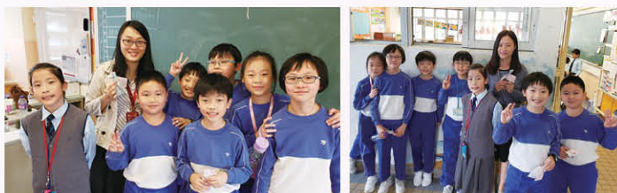
小四「成長的天空」計劃(小學) 愛心之旅活動：敬師愛生

為增強學生抗逆能力及與他人之間的正面連繫，學校邀請聖公會麥理浩夫人中心合辦成長的天空計劃(小學)，由四年級開始，抗逆大使會開展為期三年的訓練，包括有：訓練小組、挑戰日營、再戰營會、戶外歷奇訓練、親子黃昏營及愛心之旅等。