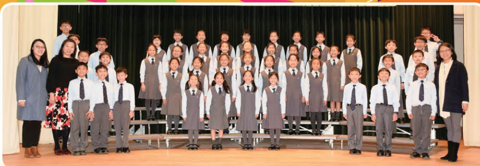
中文集誦隊榮獲第71屆香港學校朗誦節小學三、四年級粵語詩詞集誦亞軍