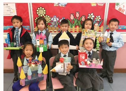
一年級學生運用生活中不同的立體廢料創作獨特的模型

為擴闊學生的眼界，提升他們的興趣，本科歷年均參與具高認受性的比賽及測試，本年度更積極推動各級學生參加更多校外數學比賽，屢獲殊榮。在多項的公開比賽中，取得兩項比賽的團體季軍、以及多項個人冠軍、個人優等獎、個人一等獎及個人金獎等殊榮。