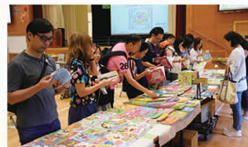
本校與香港聖雅各福群會合辦 「親親孩子說故事」計劃家長工作坊

兒童期的社交情緒發展，是愉快健康成長重要基石。故此，本校聯繫社區上的資源，與不同機構合辦成長小組及「樂天Buddies」計劃等，協助學生認識自己的獨特性，增進健康情緒。另一方面，透過「愛·連繫」正向服務計劃、「社創科技」計劃等，從服務中學習，培養正面的品德教育和健康身心靈。