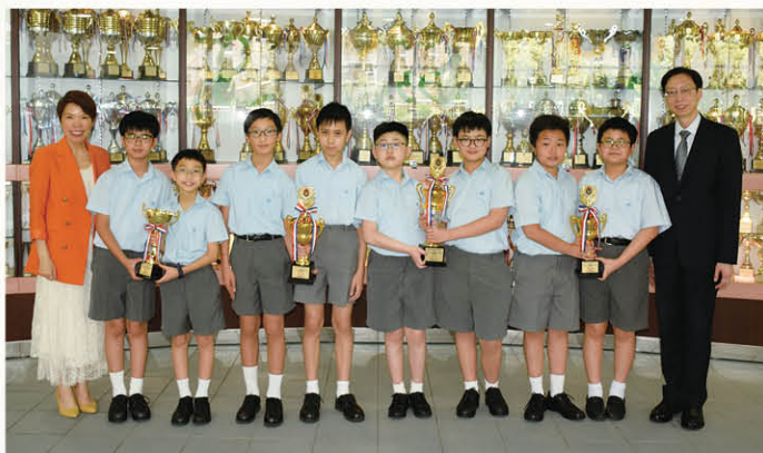
奥数校隊榮獲第二十三屆聖公會小學數學奧林匹克比賽隊際賽季軍