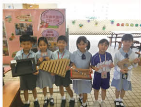
這些「自製樂器」不但造型精美，還能以不同的音高，奏出美妙的旋律。

「自主學習」是其中一種終身學習的態度。學生需要好好裝備自己以應付學習和工作的需求，因此本校配合課程學習內容，設計了三至六年級的自學冊，透過預習和課後延伸等活動，培養學生良好的自學態度。