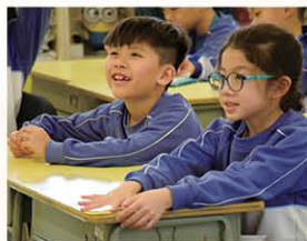
老師分享有趣的繪本故事，同學聽得津津有味。

此外，本校特別為一年級家長舉辦了兩次工作坊，讓家長認識品格培育的理念架構及品格內涵，教授家長有關繪本選書及親子伴讀之技巧，並提供實踐練習，讓家長在家中同步培育學生之正向品格。