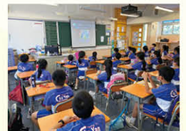
大細路劇團《班長大王》