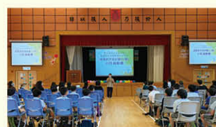
成長的天空活動四年級啟動禮