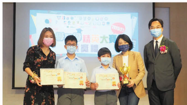
本校榮獲第六屆小學數學精英比賽 五年級「卓越學校獎」

為擴闊學生的眼界，提升他們的興趣，本科歷年均參與具高認受性的比賽及測試，本年度更積極推動各級學生參加多項校外數學比賽，並屢獲殊榮。在多項的公開比賽中，取得卓越學校獎、個人優等獎、個人一等獎及個人金獎等殊榮。