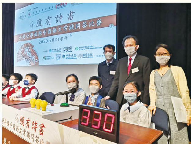
腹有詩書——全港小學校際中國語文常識問答比賽

本科亦安排多元化的語文科學習活動，讓學生體驗學習語文的趣味，包括硬筆和毛筆書法比賽、作文比賽、猜燈謎活動、語文攤位遊戲、古詩誦讀等多元化的活動。本科積極推動學生參與校外活動和比賽，如全國青少年語言知識大賽菁英盃作文比賽、腹有詩書—全港小學校際中國語文常識問答比賽等。在各項活動及比賽項目中，學生均取得佳績。