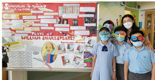
賽馬會大世界我舞台青少年莎士比亞戲劇培訓計劃

為了讓學生在豐富的語言環境下將已有的知識活學活用，本年度英文科學辦了多元化的英語活動，如Journey Through the Classics Reading Activities、English Speaking Competition、Creative Writing Competition及Comic Strip Writing Competition等。為擴闊學生對英語世界熱門話題的認識、加強師生互動交流及營造最佳的語境，外籍英語老師亦於早上時段進行Breakfast with Mr. Question活動。另一方面，本年度五年級學生參加由香港賽馬會慈善信託基金捐助的英語戲劇教育計劃——「賽馬會大世界我舞台青少年莎士比亞戲劇培訓計劃」，以鼓勵學生閱讀及探索更多有關莎士比亞的作品，並選出學生參加戲劇體驗工作坊。此外，本年度四至六年級學生亦參加了由香港浸會大學舉辦的詩歌閱讀工作坊，學生學習了一些詩歌的特徵，還學會如何以正確的發音、良好的語調和節奏朗讀詩歌。