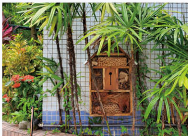
全港學界首間昆蟲酒店

複合式耕養，除美化環境外，更藉此培養學生對自然科學的興趣及認識。在環境教育方面，設有風能及光能互補發電系統、雨水收集及自動灌溉系統、單車發電系統，培養學生認識再生能源和提升環保意識。此外，本校亦於校園設置了全港學界首間昆蟲酒店，給予學生探索、觀察、發現、辨別校本生物物種多樣性的機會，一方面提升學生的歸屬感，另一方面培養學生欣賞生物之美，從而懂得愛護大自然及尊重生命。