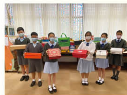
PEACE BOX祝福大行動之愛心禮物盒捐贈活動

本校與社區組織及團體保持緊密的聯繫，藉著多元化的計劃和小組等促進學生成長，擴闊學生的學習視野，增加對社會的歸屬感。本年度與學校合作的社區組織包括教育局、聖公宗(香港)小學監理委員會、聖公會小學輔導服務處、聖公宗(香港)中學委員會、聖公會麥理浩夫人中心、香港聖公會福利協會有限公司、香港離島區各界協會、香港耀能協會、香港基督教女青年會青衣綜合社會服務處、香港明愛、香港福音盛會有限公司、基督教香港信義會王賈明快樂家庭培育中心、和富慈善基金、香港學園傳道會、親子遊戲愛聯繫協會及香港有品運動等。