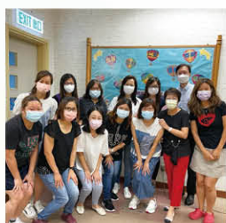
中華文化便服日家長義工

家長教師會是學校的忠誠伙伴，並積極發揮家校之間的橋樑作用，本年度在家教會的協助下，雖然疫情反覆，學校仍舉辦了兩次興趣班及六次網上家長講座。家長義工積極協助「中華文化便服日」活動及家長興趣班導師等，大大促進了家校之間的情誼及合作精神。