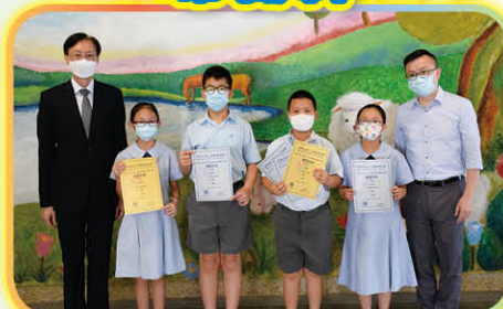
第二屆世界STEM暨常識公開賽