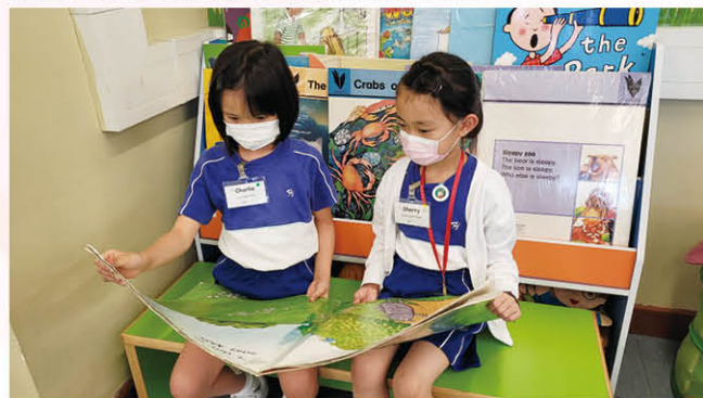
一年級英語閱讀課

英文科致力提升學生聽、說、讀、寫四方面的能力。在一至三年級推行PLPR英語閱讀計劃，採用不同的故事書，進行「分享閱讀教學法」及多元化的語文學習活動及寫作活動；另一方面於四至六年級進行校本英語閱讀課程，運用有趣的英語讀物，訓練學生從多角度分析思考，從而培養學生對學習英語的興趣。本年度運用不同的電子學習工具滲入校本課程，使學生在學習英語的過程中，有更多機會使用多媒體學習資源，除了提升學生在課堂上的學習動機外，亦應用於課前預習及課後鞏固，提升自主學習的能力，使英語學習變得更多元化及更具趣味性。此外，本年度發展網上評估作為促進學習的進展性評估，透過數據分析，教師能有效跟進學生的學習進度及表現，並提供改善建議。