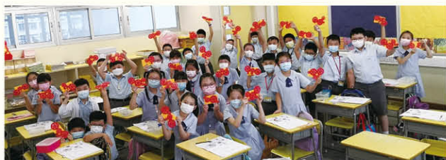
大家成功完成拼砌齒輪比學具。

「自主學習」是其中一種終身學習的態度。學生需要好好裝備自己以應付學習和工作的需求，因此本校配合課程學習內容，設計了校本課業，透過預習和課後延伸等活動，培養學生良好的自學態度。