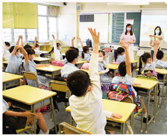
老師在課堂上分享繪本故事，同學踴躍回應。