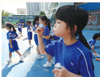
校內創意寫作課程——吹泡泡活動

除此之外，本科在各級均設有創意寫作課程，如吹泡泡、開茶會、放紙飛機、做湯圓、參觀香港歷史博物館及香港濕地公園。希望藉著豐富多元的活動，讓學生切身體驗，增強學生的觀察能力，從而提升學生寫作的興趣和能力。