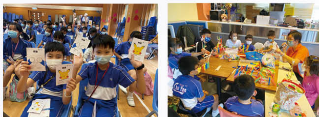
「關愛飛揚計劃」為全校學生推行情緒健康講座及舉辦情緒小組支援活動

同時，為增強學生抗逆能力及與他人之間的正面連繫，學校邀請聖公會麥理浩夫人中心合辦成長的天空計劃(小學)，由四年級開始，抗逆大使會開展為期三年的訓練，包括有：訓練小組、挑戰日營、再戰營會、戶外歷奇訓練、親子黃昏營及愛心之旅等。