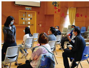
一年級家長出席工作坊，學習親子伴讀的技巧。