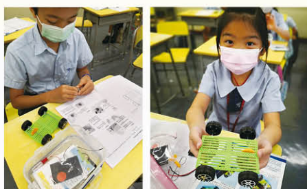
在課堂上組裝太陽能車。

此外，常識科亦推行校本STEM教育，從而培養學生的學習興趣、提升解難能力、發展創新思維及邏輯思維。課程設計著重學生從預測、觀察、解釋中學習，並透過多元化實驗主題，建構學生的科學知識及探究精神，過程強調認知及體會。同時亦鼓勵學生將學到的知識付諸應用，發揮創意，自行創作可在現實生活中應用的科技產品。