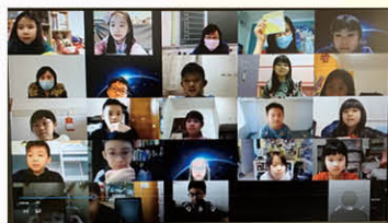
在暫停面授課期間，老師及社工利用Zoom進行「品格生活課」。