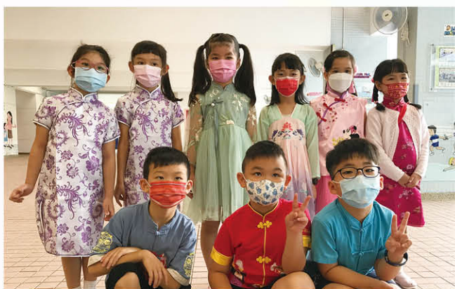
中華文化日活動——齊說普通話

本校學生積極參與各項普通話比賽和公開考試，並獲得優異成績，雖然因疫情影響令多項比賽取消，但本校學生在第72屆學校朗誦節中仍取得不少獎項，包括獨誦冠軍5項、亞軍2項、季軍2項、優良獎43項。本年度共有2名學生參加國際教育研究中心舉辦的「少兒普通話水平測試」和2名學生參加北京大學舉辦的「GAPSK港澳地區中小學普通話水平測試」，並取得優良的成績。另外，本年度有1位學生參加香港學界朗誦大賽，並取得季軍佳績。