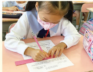
一年級學生自製厘米尺

為配合新課程，本年度重編了一、二及四年級校本「樂滿分課程」，並將解難課程、GeoGebra等網上資源滲入「樂滿分課程」之中，讓解難課題與課本學習重點更有聯繫。