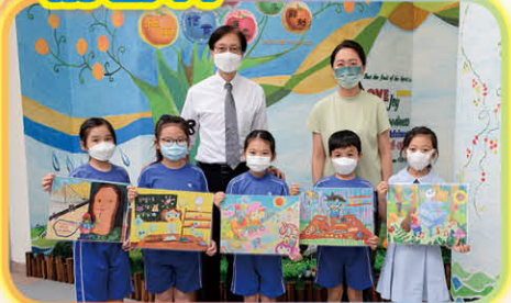
本校學生榮獲ICEHK舉辦的2021「啟夢啟想」 國際繪畫比賽學校獎亞軍、一等獎10名、 二等獎21名、三等獎12名及優異獎17名。