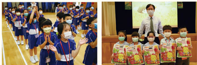
「同你做個好朋友」小一適應活動

本校以「培養學生正向思考，學會感恩，關顧他人」為關注目標，積極推行關愛活動及建構和諧校園，實踐上帝要我們彼此相愛的教導。透過舉辦不同形式的關懷活動，如：「關愛大使」、「生日歌聲遍校園」、「社工室愛分享」、「同你做個好朋友」小一適應活動、「童分享」及「童感恩」生命教育課，營造互助互愛校園文化，促進老師與家長及學生的關係。