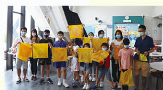
關愛飛揚親子日營