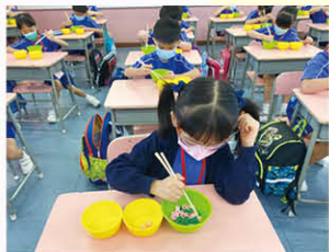
同學在「堅毅」課堂中進行體驗活動。