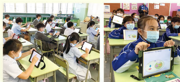
四年級學生運用iPad、Nearpod學習「四邊形的包含關係」

均建立了Google Classroom電子平台，各班教師均於平台上載網上自學連結，高年級還上載學習材料、評估課業等資源；部分級別定期把每週《數學趣題考考你》的題目以Google form形式，在Google Classroom中派發給學生完成。四年級教師在教授「四邊形的包含關係」時更運用Nearpod製作電子教材。教師運用電子工具，讓抽象的概念視覺化呈現，並以探究模式讓學生建構數學知識，有助提升學生解難能力及抽象思維能力。