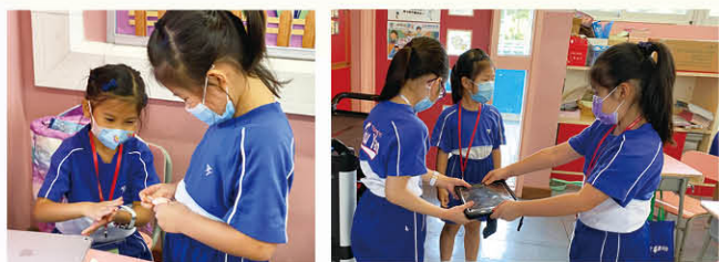
積極推行「童感恩」生命教育課，營造互助互愛的校園文化