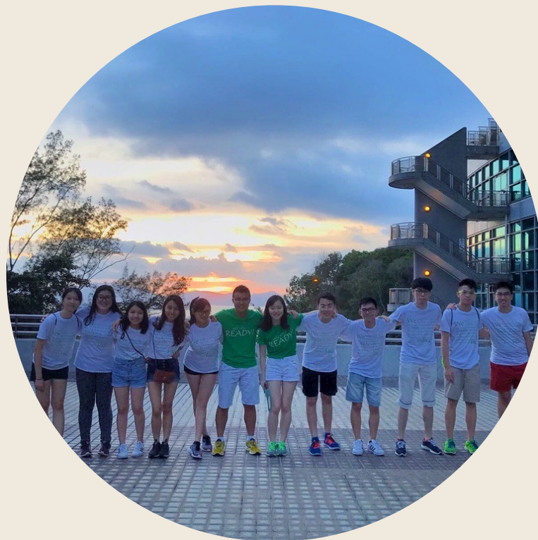
兩所大學醫學院舉辦體驗營給有志投身於醫學界的中學生