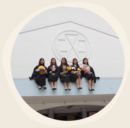
聖公會林護紀念中學