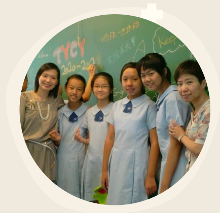
聖公會青衣主恩小學