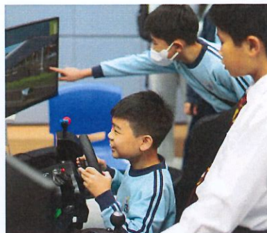
模擬飛機及汽車駕駛