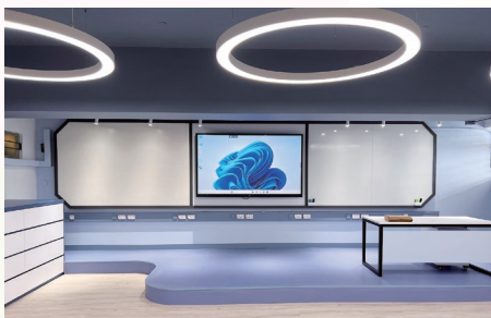
充滿科技感的STEAM教室，是同學喜歡上課學習新科技的地方

本校成功申請優質教育基金，發展「識創科·釋創意—STEAM互動教室」計劃。本年度提供一個理想的學習空間，讓學生進行創科學習，透過協作、探究、體驗和應用科技，在互動學習的同時，提升他們的數碼創造力、協作能力和解決問題的能力。期望學生除了學會運用科技知識解決環境問題外，更培養關心社會的態度，將來成為致力改善環境、貢獻社會的好公民。