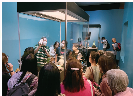
教師專心聆聽導賞員分享文物的歷史

2022年8月23日為第一次教師專業發展日，主題為「國家安全教育」教師工作坊。當天由教育局課程發展處德育、公民及國民教育組吳俊輝先生到校為教師分享，加強教師認識在全校層面、各學習階段及課堂內外統籌與策劃國家安全教育的工作。