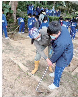
學生在「感恩惜食」活動中體驗農夫工作的辛勞，從而學習珍惜食物。