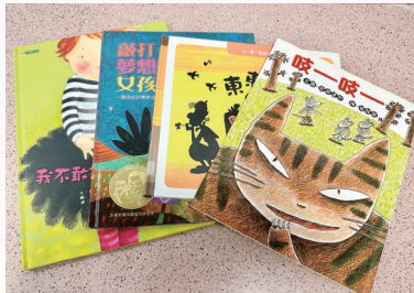
品格課程中的繪本故事

此外，本學年全校學生亦參與了「我的行動承諾——感恩珍惜、積極樂觀」計劃。本計劃是由本校與聖雅各福群會Rachel Club合辦，透過參與不同的體驗活動，例如：製作感恩瓶、「感恩惜食」戶外體驗日、「方舟生命教育館」體驗活動及「童樂同享」義工服務活動等，讓學生學習如何運用樂觀的態度看待事情，對生活中發生的各項事情保持希望，鼓勵學生在日常生活中持續發揮品格強項。