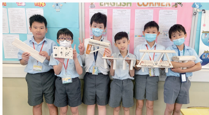
三年級學生利用簡單的物料，設計及製作一道能夠承托重物的紙橋

同時，本校亦積極推動各級學生參加校外各項數學比賽及測試，在多項的公開比賽中屢獲殊榮。本年度分別取得多項團體冠軍、團體亞軍、個人雙優生、個人優等獎、個人特等獎、個人一等獎、個人金獎等佳績。