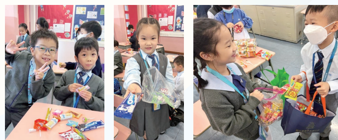
定期舉行生日會，分享愛心與關懷。

透過舉辦不同形式的關懷活動，如：「關愛大使」、「愛筵大使」、「生日歌聲遍校園」、「社工室分享愛」、「童你做個朋友」小一適應活動、「童桌遊歷——桌上遊戲小組」、「小學朋輩調解員」訓練、第28屆表揚教師計劃及第29屆家長也敬師運動等，營造互助互愛的正向校園文化，促進老師與家長及學生的關係。