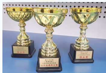
榮獲「常識百搭」小學STEM探究展覽第24屆傑出獎 第25屆二十五週年大獎及傑出獎

本校常識科課程發展以探究式學習為中心，有系統地設計學習內容及活動，當中包括一至六年級的校本課程設計、STEAM研習課程、價值觀主題教育活動等。