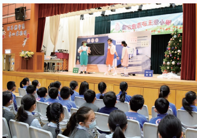
同學們都專注地欣賞普通話劇場

本校各級每星期均有普通話課，培養學生普通話的聽說能力。此外，為營造學習普通話的語境及提升學習趣味，本年度舉辦了不同類型的趣味活動，包括普通話劇場、伴讀計劃、普通話節目播放、聲韻母背誦活動及普通話知識大比拼等。