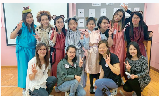
家長閱讀大使與同學一起進行閱讀活動

本年度學校招募了60位家長義工成為閱讀大使，在校內為學生進行英語伴讀、廣東話及普通話閱讀活動，有效增進學生的閱讀興趣。