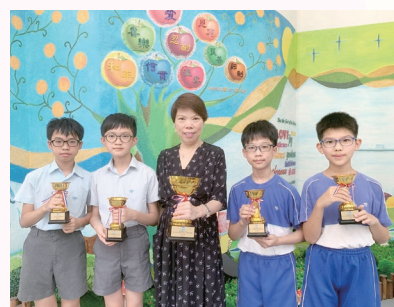
在荃葵青小學數學競賽2022中勇奪團體冠軍

「疑難為本，探究式學習」乃本校數學科課程核心目標，本科運用多元化的教學策略和電子學習元素，致力發展學生的探究、解難及高階思維能力，從而建構數學概念。