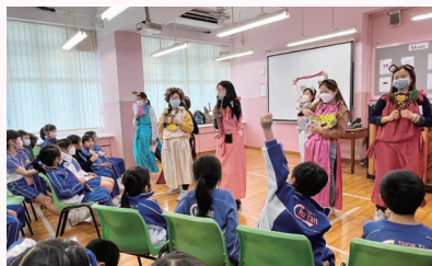
故事媽媽以普通話與同學進行午間互動劇場時，同學均表現得十分投入

本校學生積極參與各項普通話比賽和公開考試，獲得優異的成績。在第74屆校際朗誦節中，學生取得不少獎項，包括：獨誦冠軍4項、亞軍5項、季軍12項、優良獎41項。本年度共有24名學生參加了國際教育研究中心舉辦的