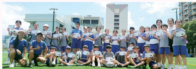
語文教育及研究常務委員會與香港欖球總會社區基金合辦「Rugby English Active Learning」英語欖球學習活動

英語話劇組把《約瑟的神奇彩衣》改編成同名話劇《Joseph and His Dreamcoat》，於Hong Kong School Drama Festival 2022/23獲得多個獎項。