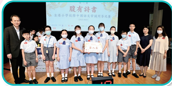
腹有詩書全港小學校際中國語文常識問答比賽 第八名 腹有詩書教育獎