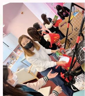
家長義工將師生捐贈物資包裝成福袋，送給長者。

配及包裝，家校一心延續關愛精神。另外，亦組織及培訓了12名高年級學生到長者中心探訪長者。學生們與長者玩遊戲、唱歌、聊天，讓長者感到非常開心。學生們也表示，體驗讓他們更深入地了解區內長者，對長者留下正面的印象，感覺世代之間不存在隔閡。本校努力展現了關愛和分享的精神，也為學生們提供了難忘的學習機會。