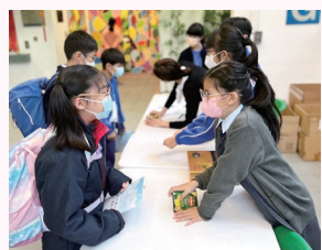
「祝福送暖行動」：學生協助收集同學捐贈的物資。