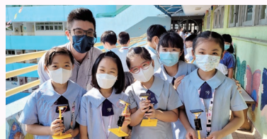
學生製作太陽能檯燈後，於走廊進行測試。

培育學生的正向思維亦是本校常識科課程發展的重點。價值觀教育貫穿日常課程內容，從學生的生活經驗出發，培育學生關愛及尊重他人、富責任感、堅毅、守法、具同理心等正面的價值觀、態度和行為，達至全人發展。學生透過訂立個人發展計劃、海報設計等活動，建立積極正向的生活態度。