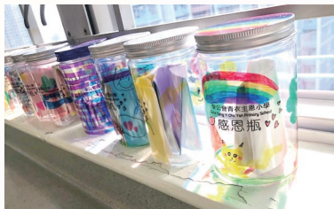
課室設立感恩角，鼓勵學生把感恩事情寫下來，並存放於感恩瓶內。