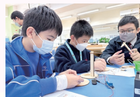
學生參與「感光小夜燈製作工作坊」活動。