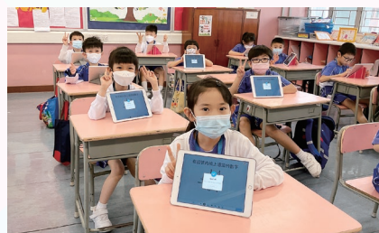
一年級學生運用iPad、Nearpod進行數學科電子學習活動

善用資訊科技優化教學是本科的重點發展項目，因此各級的樂滿分課程加入電子學習元素，利用GeoGebra互動學習工具，讓學生能透過實際操作去掌握抽象的數學概念。教師還運用Nearpod、Kahoot等電子資源於課堂教學或課後鞏固溫習，以提升學生的學習興趣及主動性。