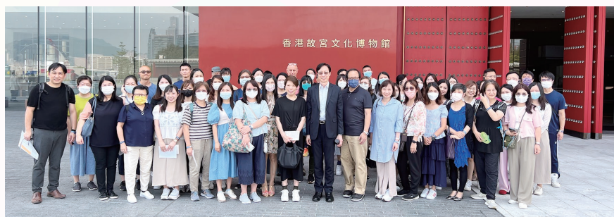
教師於香港故宮文化博物館門前大合照

2023年6月2日為第四次教師專業發展日，全體教師參觀「香港故宮文化博物館」，並由香港導賞學會導賞員帶領教師分組參觀主題展廳。透過導賞及參觀活動，讓教師了解博物館蘊藏的教學資源，有助教師作為課堂教學及跨學科學習的延伸材料。