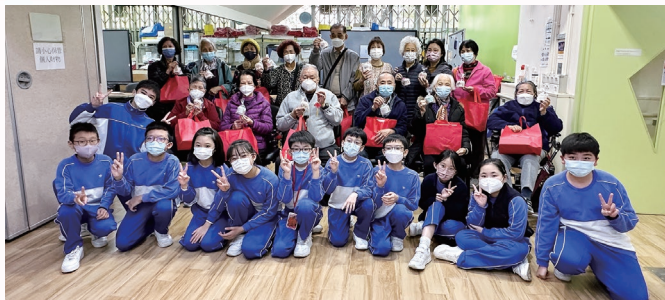
六年級學生參與「童樂同享」義工服務