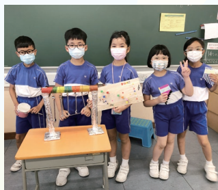
學生自製不同的樂器，組成「樂團」。

「自主學習」是終身學習的過程中必不可缺的技能。學生透過建立目標、規劃並監察自己的學習進程，定時作出自我評鑑並修訂學習計劃，成為自己學習的主導者。本年度常識科加入「STEM自主學習課程」，讓學生善用課餘時間，在家中完成製作並測試STEM產品，從而提升學生的自主學習能力，並培育學生積極、自學的精神。