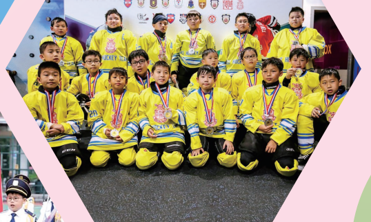
HONG KONG SCHOOL ICE HOCKEY LEAGUE 香港校際冰球聯賽