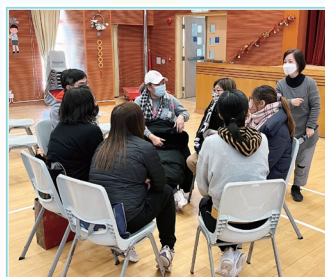
做個情緒輔導型父母家長講座，分組討論環節

本校與社區組織及團體保持緊密的聯繫，藉著多元化的計劃和小組等促進學生成長，擴闊學生的學習視野，增加對社會的歸屬感。本年度與學校合作的社區組織包括聖公宗（香港）小學監理委員會、聖公會小學輔導服務處、聖公宗（香港）中小學委員會教育心理服務、香港聖公會福利有限公司、香港聖公會福利協會心意行動、香港聖公會麥理浩夫人中心（青衣邨社區會堂）、香港聖公會麥理浩夫人中心、成長希望基金會、南青衣綜合家庭服務中心、香港小童群益會家庭生活教育組、香港明愛、香港基督教女青年會青衣綜合社會服務處、家福會、博愛醫院兒童及家庭服務（青衣區）、新生會、聖雅各福群會、電影、報刊及物品管理辦事處、積金局、謝家亮說話訓練學院、本區多間中學等。