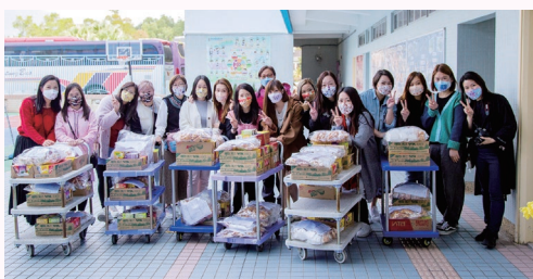
中華文化便服綜合活動日家長義工

家長教師會是學校的忠誠伙伴，並積極發揮家校之間的橋樑作用。由於疫情放緩，生活復常，在家教會的協助下，多項活動也如常舉行，本年度共舉辦了9次興趣班及33個家長講座。家長義工團隊也積極協助日常活動如「午膳爸媽」、「家長閱讀大使」、疫苗注射及學生相拍攝。此外，家長義工更熱心參與協助「校運會」、「English Fun Day」、「中華文化便服綜合活動日」、「家長教師會親子旅行」、六年級畢業禮及「STEM Day」等大型活動，大大促進了家校之間的情誼及合作精神。